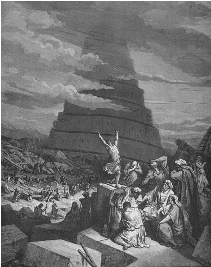
Gustave Doré: Die Sprachverwirrung (Turmbau von Babel), 1865