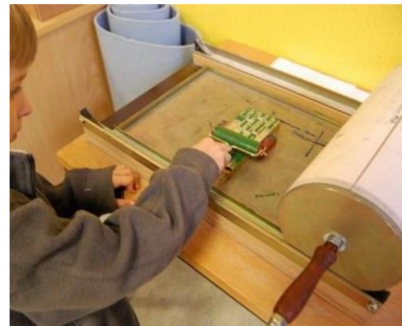
Eigene Texte selbst drucken