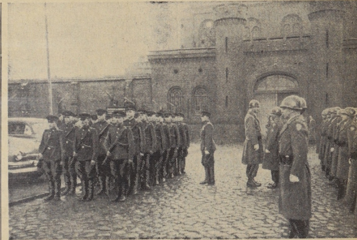
Nach bestimmtem Turnus vollzieht sich die Ablösung der Wachmannschaft, die abwechselnd von einer der alliierten Besatzungsmächte gestellt wird, für das Gefängnis in Berlin-Spandau. Hier die Ablösung zwischen den Amerikanern und den Russen.

London, 3. Dezember. (AP) Premierminister Churchill erklärte auf Anfrage vor dem Unterhaus, die britische Regierung beabsichtige nicht, ihre Politik gegenüber Rotchina zu ändern.