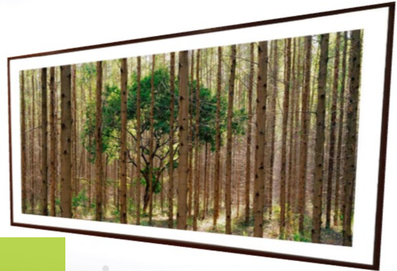
Sufocamento #11 De série Madre de Lei Pedro David Fotografia 2014 Acervo Roberto Alban Galeria