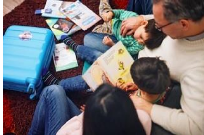
C: Hamburger Bücherkoffer