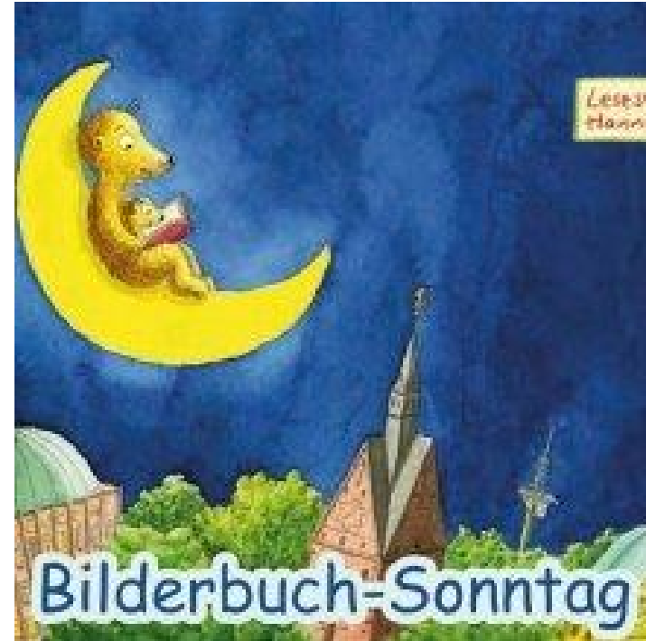
C: Stadtbibliothek Hannover