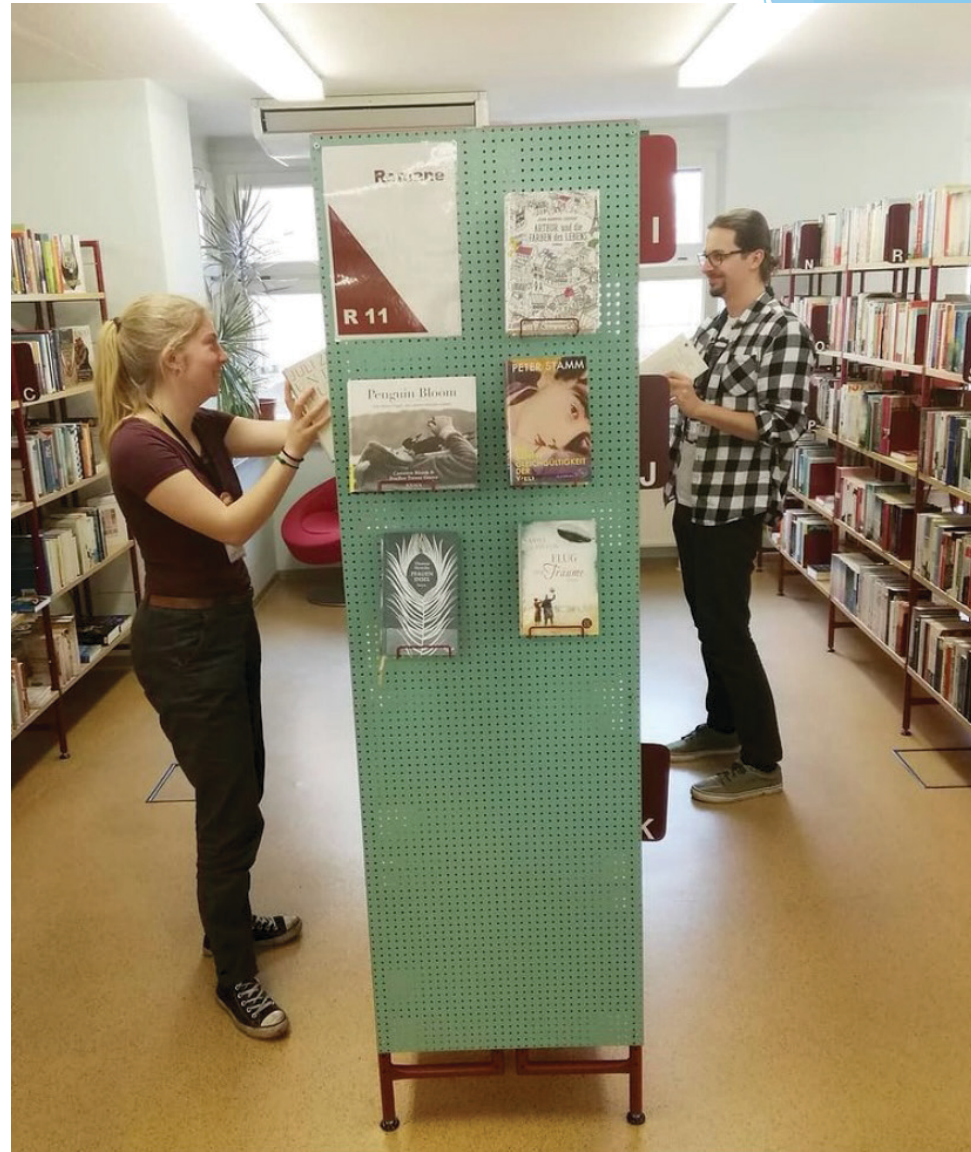
Azubi-Projekt 2019. Bibliothek Blasewitz