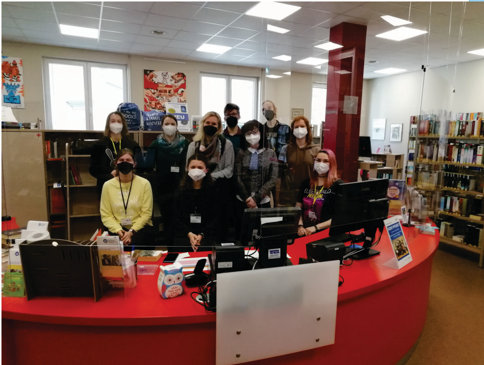
Azubi-Projekt 2022. Bibliothek Neustadt