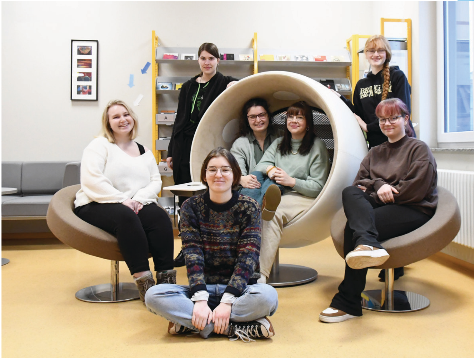
Azubi-Projekt 2023. Bibliothek Neustadt