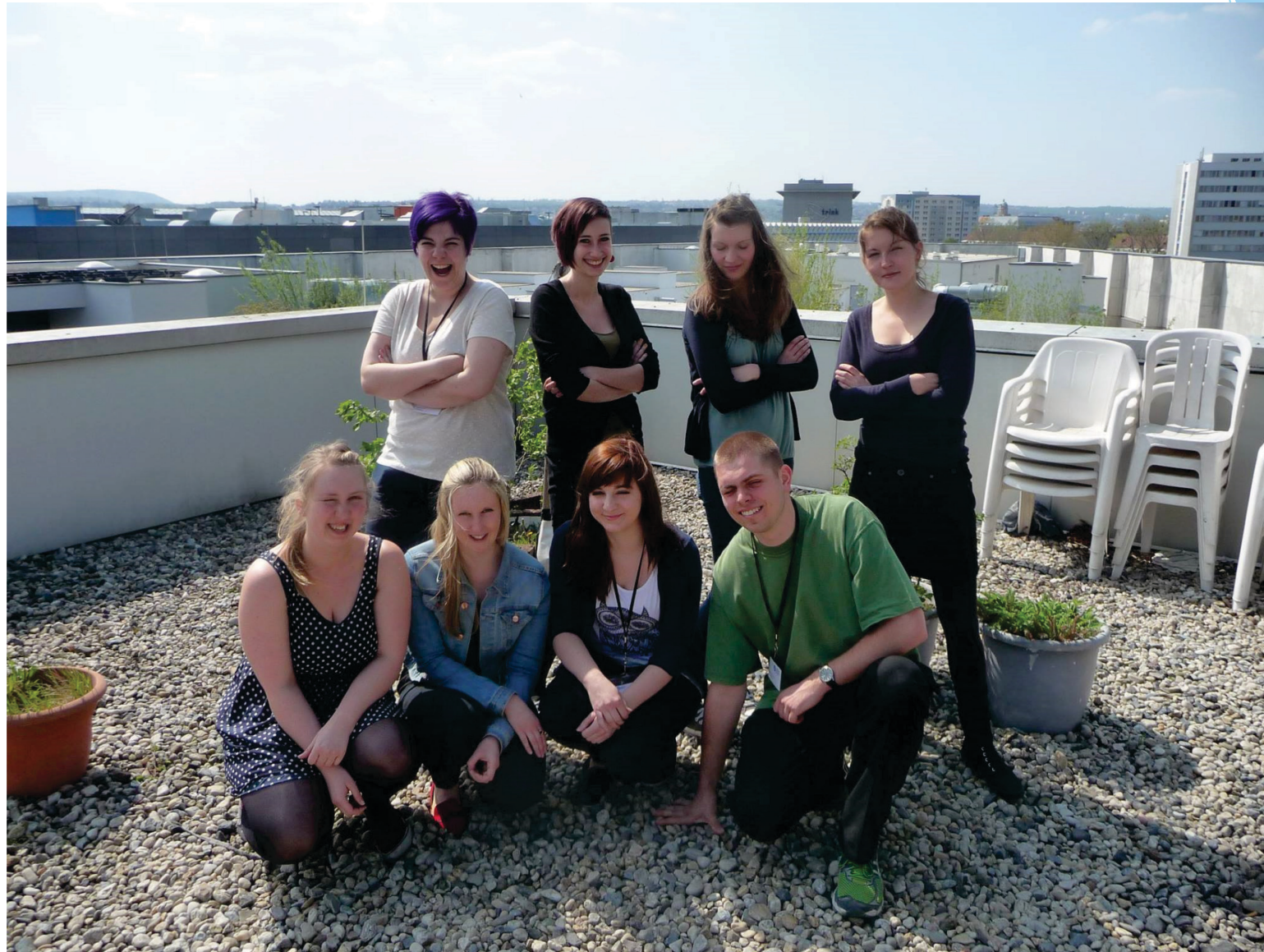
Azubi-Projekt 2015. medien@age