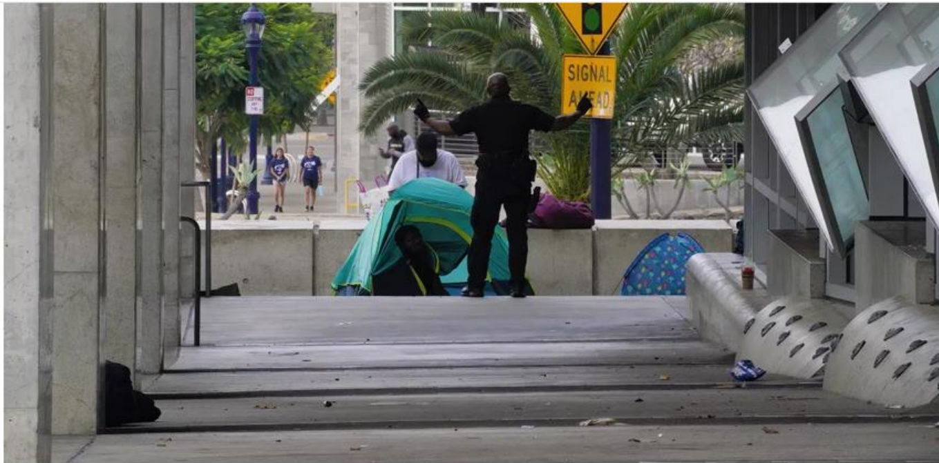
A tent set up on the sidewalk just outside the San Diego Central Library on Thursday, Aug. 18.