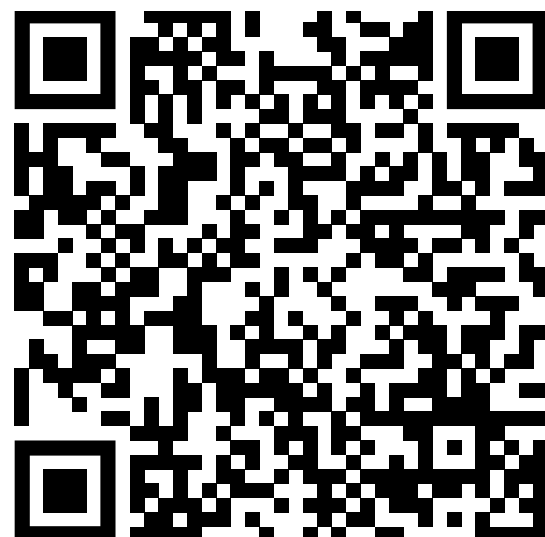
Link zur Monografie