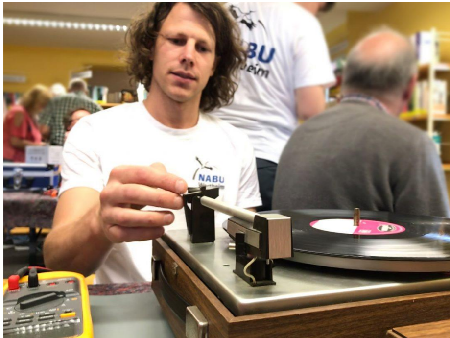
Repaircafe Wertheim