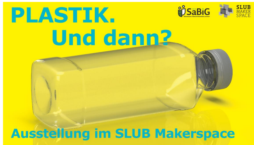
SLUB Makerspace of the Sächsische Landesbibliothek - Staats- und Universitätsbibliothek Dresden