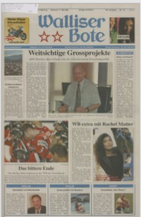
Walliser Bote 17. Mai 2006