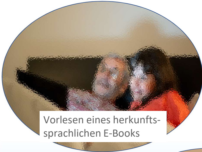
Vorlesen eines herkunftssprachlichen E-Books