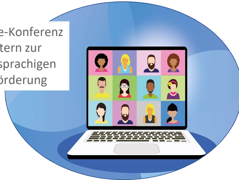
Online-Konferenz mit Eltern zur mehrsprachigen Leseförderung