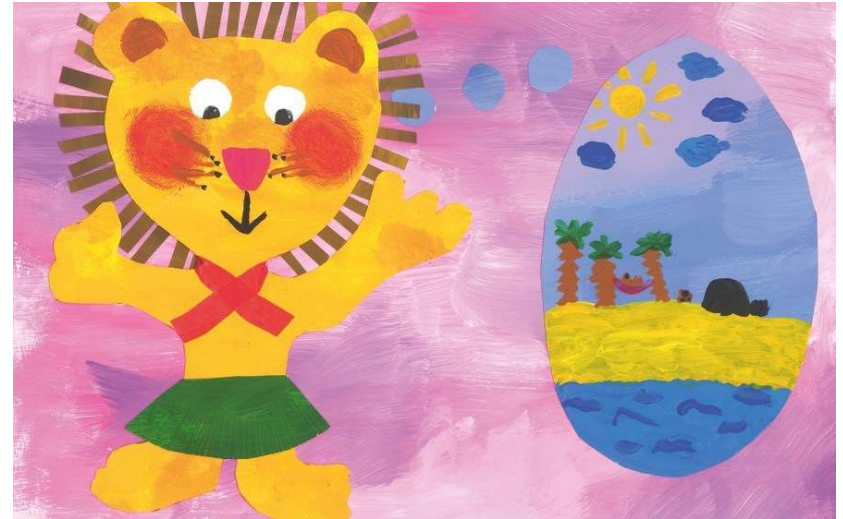
Schokokuchen auf Hawaii, mehrere Autor*innen und Illustrator*innen, auf bilingual-picturebooks