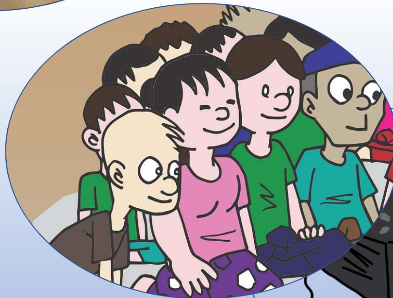
Web- oder appgestütztes Bilderbuchkino in der Bibliothek, eingebettet in bibliothekspädagogische Aktivitäten