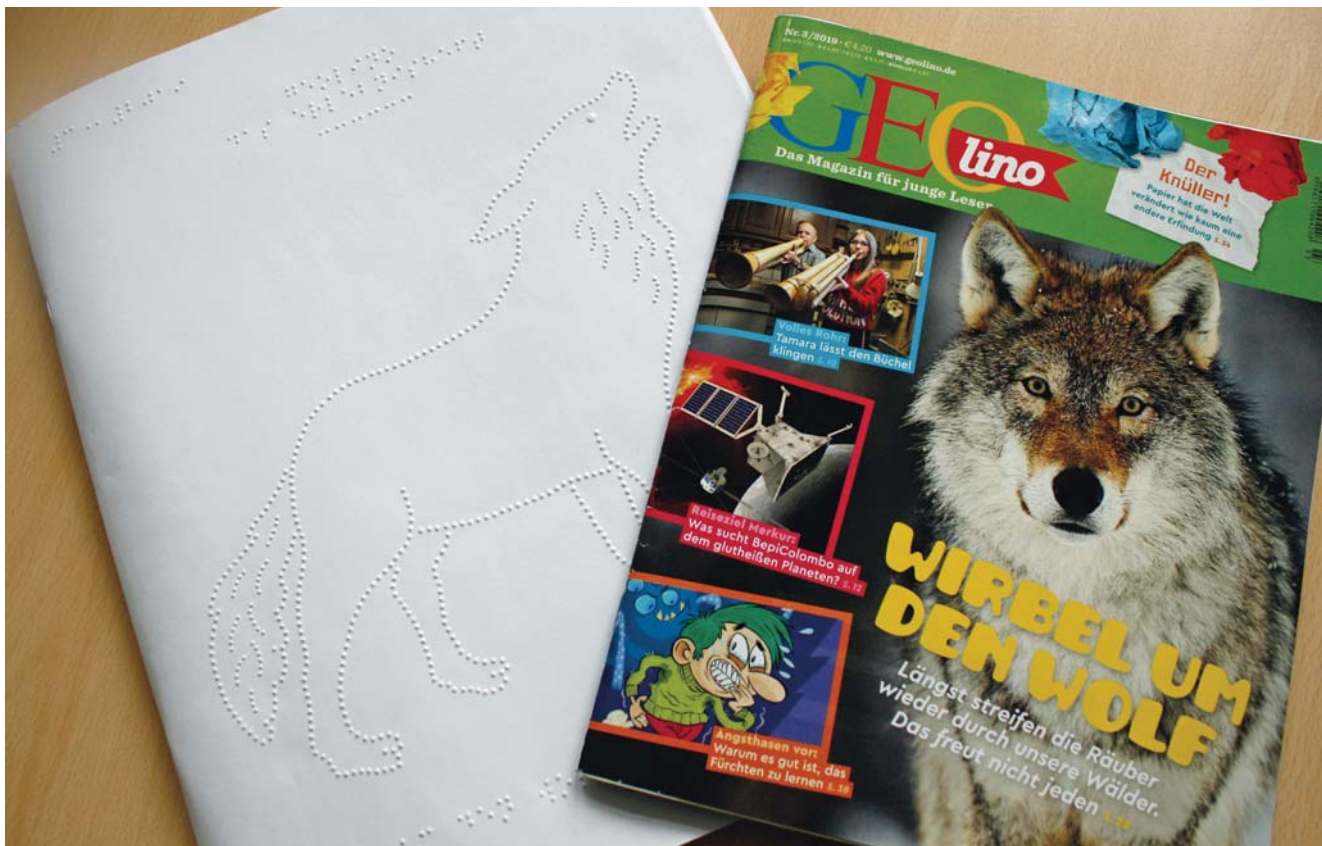
Auf den Wolf gekommen: Auch die Kinder-Zeitschrift GEOlino gibt es als Braille-Version. Mittelfristig könnten auch barrierefreie E-Books auf den Markt kommen.

die bisher vom Lesen ausgeschlossen sind, ist die Vision des Marrakesch-Vertrages und Ziel von Barrierefreiheit und Inklusion in Bibliotheken.