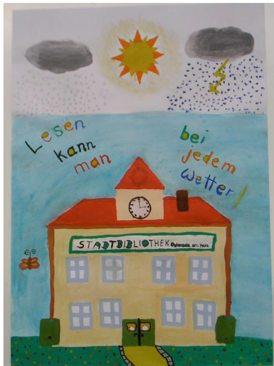
Stadtbibliothek Osterode am Harz