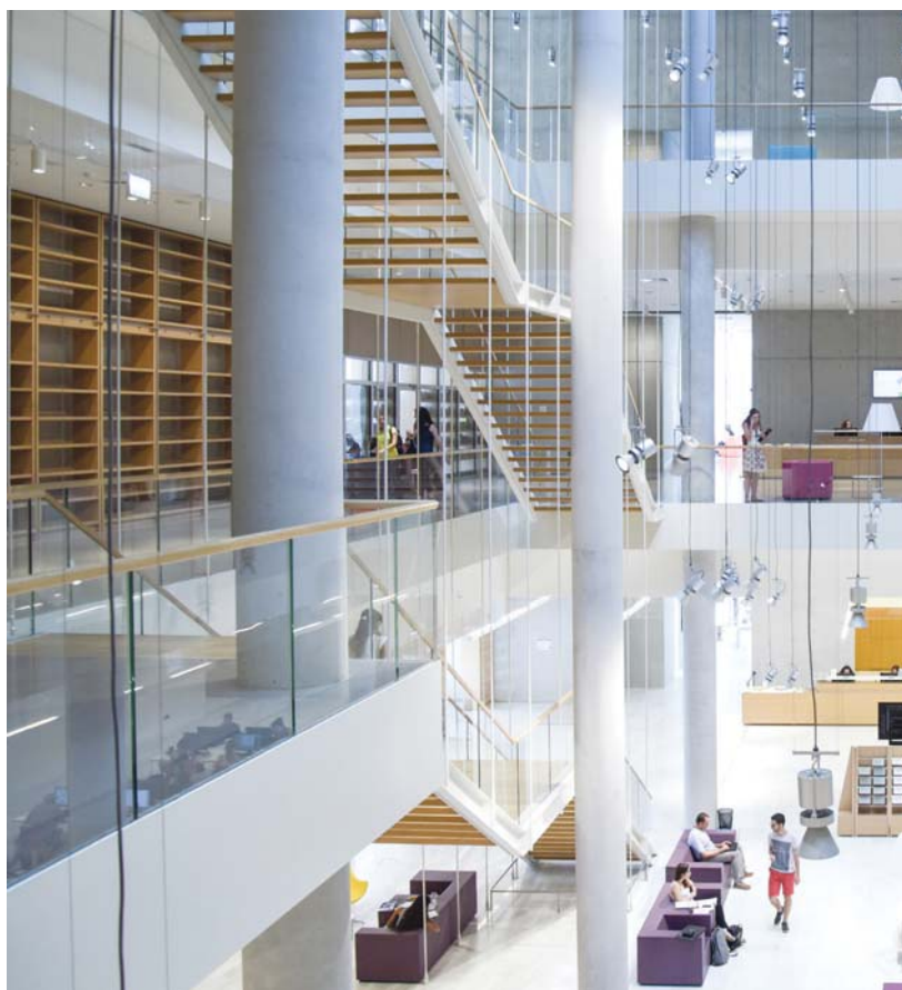
Hell und lichtdurchflutet: Der offene Lesesaal der neuen Nationalbibliothek von

Der Hochschulbereich ist von den Forderungen und Maßnahmen der regionalen, nationalen und globalen Politik geprägt. Hochschulen stehen dabei vor der Herausforderung, noch produktiver zu werden, die Bedürfnisse des wirtschaftlichen Umfelds zu berücksichtigen, qualitativ hochwertige Lehrpläne anzubieten und innovative Forschung in allen Bereichen zu fördern (Moniarou-Papaconstantinou, 2018). In Griechenland