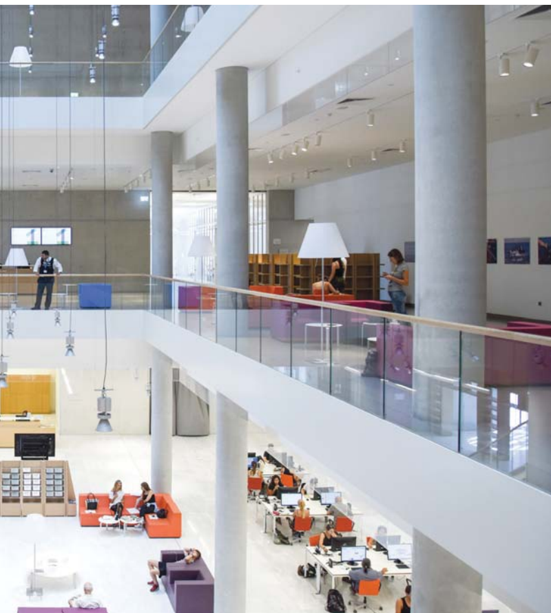
Griechenland in Athen.

Rolle im Bildungs- und Forschungsprozess einnehmen (Diaz und Mandernach, 2017).