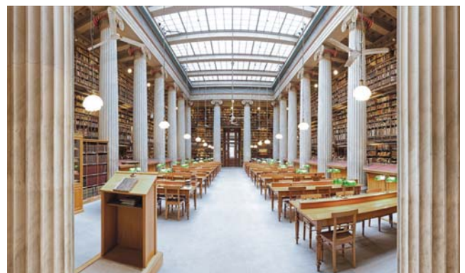
Die Villa Vallianeio war bis 2018 Sitz der Nationalbibliothek Griechenlands. Künftig sollen hier Veranstaltungen stattfinden.

Auch der Beruf des Bibliotheks- und Informationswissenschaftlers (LIS) ist von diesen Entwicklungen erfasst worden. Vor allem die Öffentlichen, kommunalen und Wissenschaftlichen Bibliotheken haben die durch die Wirtschaftskrise eingeleiteten Veränderungen deutlich zu spüren bekommen (Vasilakaki, 2015; Vasilakaki und Moniarou-Papaconstantinou, 2016).