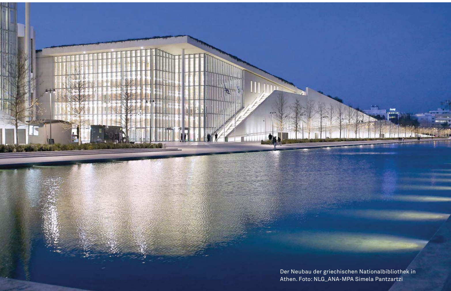
Der Neubau der griechischen Nationalbibliothek in Athen.

Valentini Moniarou-Papaconstantinou, Evgenia Vassilakaki