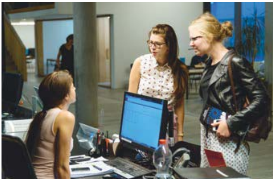
Thekengespräch: Nach Einschätzung der Mitarbeiterinnen finden an den Ausleih- und Informationstheken zeitweise über 50 Prozent der Dialoge auf Englisch statt.

2017 wurde ein Drittel der Studierenden auf Englisch in die Benutzung eingeführt. Um diese Herausforderung zu meistern, ist das Sprachenzentrum unserer Universität ein wichtiger Partner. Im Rahmen des admINT-Projekts entstand die Idee eines