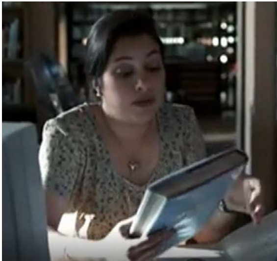
Law and order, McCoy unter Druck, Reg.: J. Alexander, USA, 1996