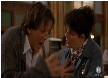
Lorenzos Öl, Reg. G. Miller, USA, 1992