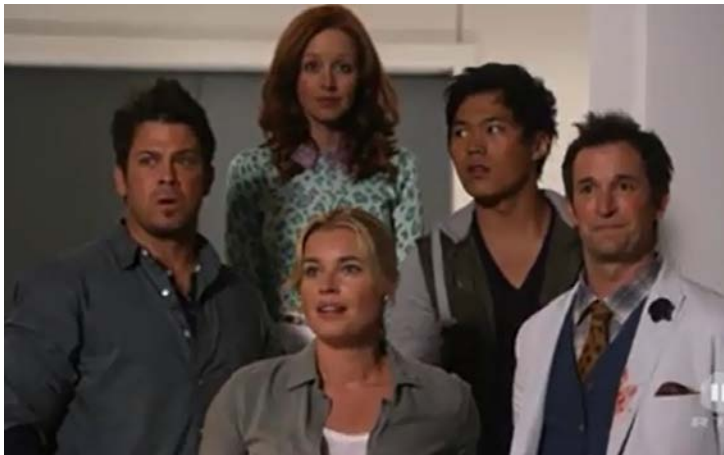
The Quest/The Librarians, Webstuhl des Schicksals, Reg.: J. Frakes, USA, 2014