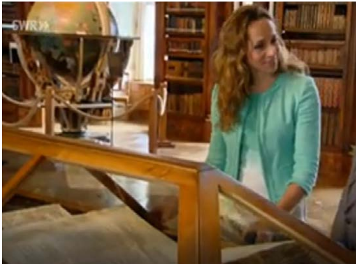
Wunderschön, Natur und Genuss am Bodensee, Drehb.: U. Bartels, D, 2013