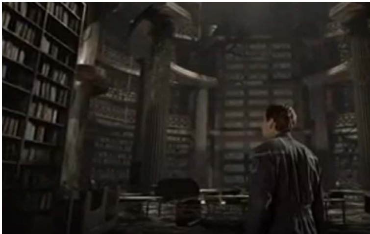
Star Trek: Enterprise, Schockwelle, Reg.: A. Kroeker, USA, 2002