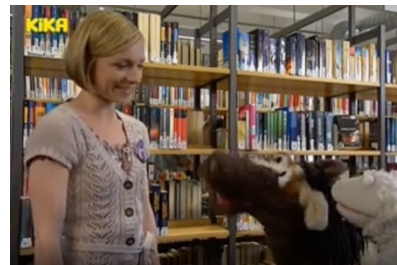
Eine Möhre für zwei, Bücher über Bücher, Reg.: J. Wolff, T. Pohl, D, 2012