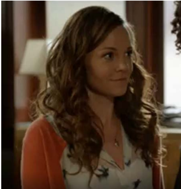
Witches of East End, Unheil zieht auf, Reg.: M. Waters, USA, 2013