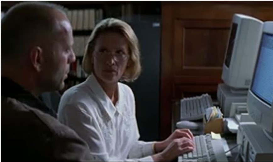
Mercury Puzzle, Reg.: H. Becker, USA, 1998