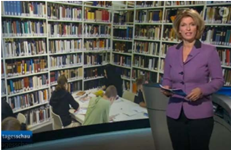
Tagesschau, ARD, D, 24.10.2016