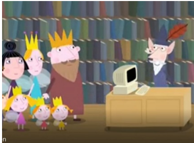
Ben und Hollys kleines Königreich, Wohin gehen die Sterne, Reg. N. Astley, M. Baker, GB, 2010