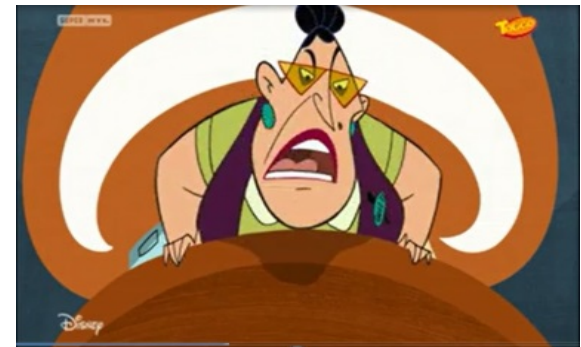
Kim Possible, Überfällig, Reg.: C. Bailey, USA, 2005