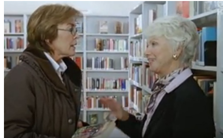
1:0 für das Glück, Reg. W. Bannert, D, 2008