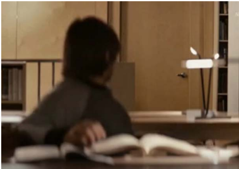
The Magicians, Verbotene Magie, Reg.: M. Cahill, USA 2015