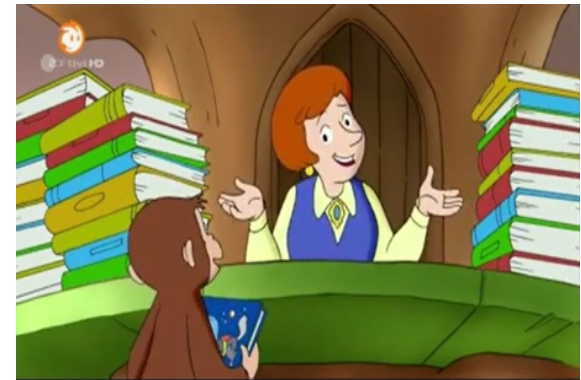
Coco, der neugierige Affe, Ein eifriger Bücheraffe, Reg.: S. Socki, USA, 2010