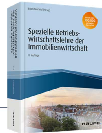
Murfeld Spezielle Betriebswirtschaftslehre der Immobilienwirtschaft 8. Auflage 2018