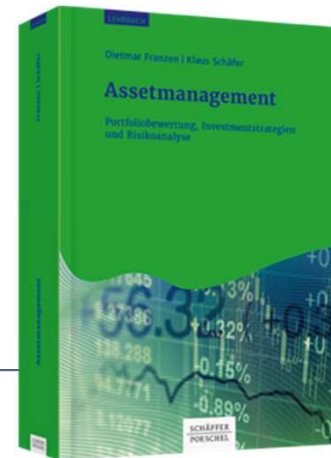
Franzen/Schäfer Assetmanagement 1. Auflage 2018