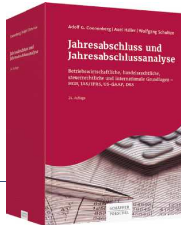
Coenenberg/Haller/Schultze Jahresabschluss und Jahresabschlussanalyse 25. Auflage 2018