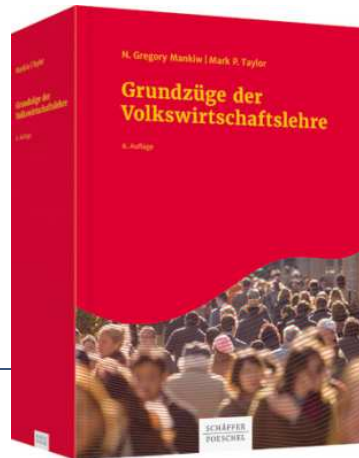
Mankiw/Taylor Grundzüge der Volkswirtschaftslehre 7. Auflage 2018