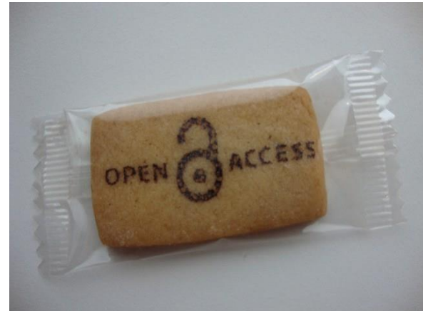
Open Access Cookie. CC BY-NC-SA 2.0 DE. © biblioteekje