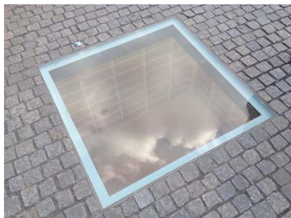
Das Mahnmal zur Bücherverbrennung am Bebelplatz in Berlin.

Geflüchtete mit ihren Kindern. Es hat mich sehr berührt, wie sehr die Kinder es genießen konnten, ihrem anstrengenden Alltag hier ein wenig zu entkommen. »Unsere Kinder – unsere Zukunft« heißt ein Projekt und umfasst rund 3 000 Medien, die meisten davon mehrsprachig. Die multilingualen Medienangebote helfen Geflüchteten bei der Sozialisation ihrer Kinder und der besseren Vermittlung der deutschen Sprache. Neben der internationalen Kinderbibliothek, werden auch spezielle Führungen für Geflüchtete angeboten. Ich bin so stolz auf »meine« Stadtbibliothek in Duisburg.