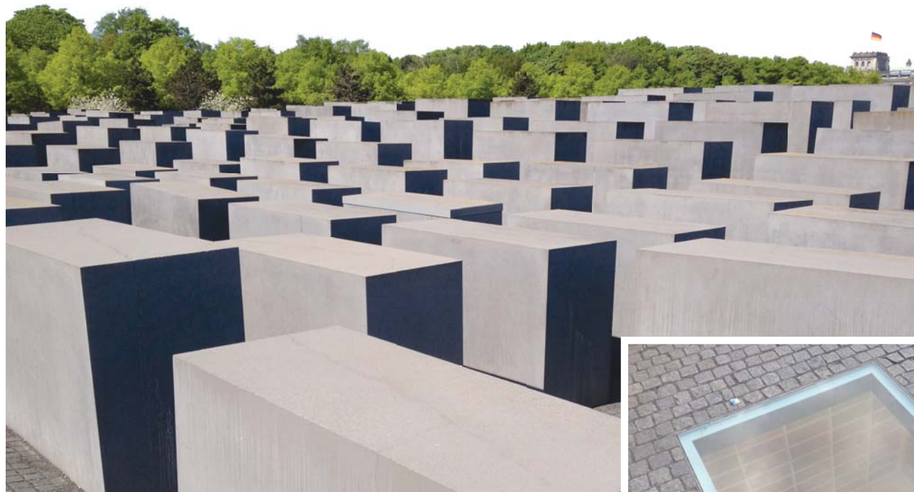
Das Holocaust-Mahnmal nahe des Brandenburger Tors in Berlin.