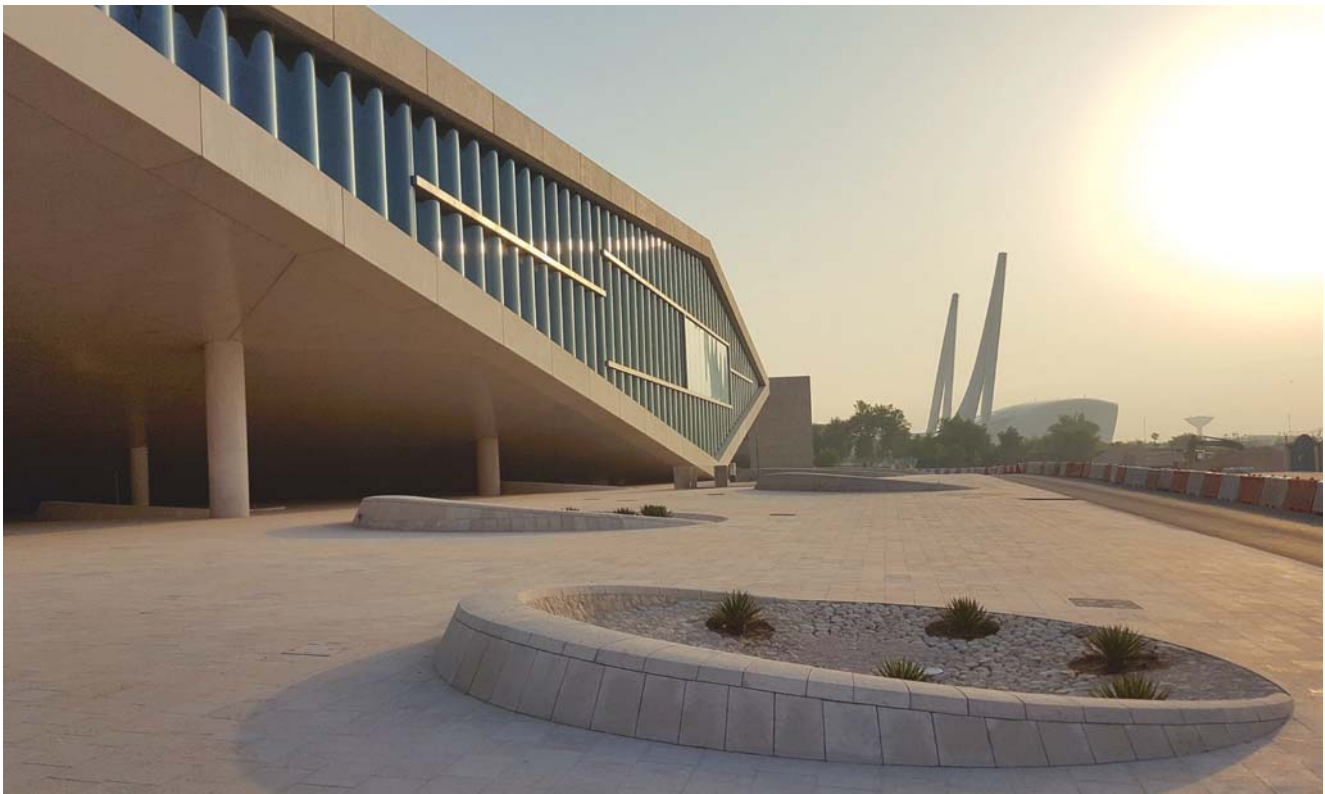
Die Nationalbibliothek von Katar wurde 2017 eröffnet. Fachkräfte wurden vor allem aus dem Ausland angeworben.