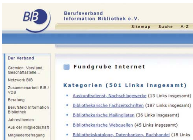
Abbildung 1: Die »Fundgrube Internet« des BIB, einer der letzten bibliothekarischen Webindices: www.bib-info.de/?id=103 .

die sich bisher auf der Mailingliste verständigte – auf bereits kommunizierte Inhalte zurückgreifen könne, denn auch die Dokumentation sei wichtig. Wo keine Dokumentation möglich ist, müssen Themen gegebenenfalls wieder und immer wieder angefragt und diskutiert werden.