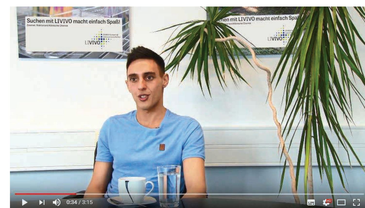
Interview für den Film