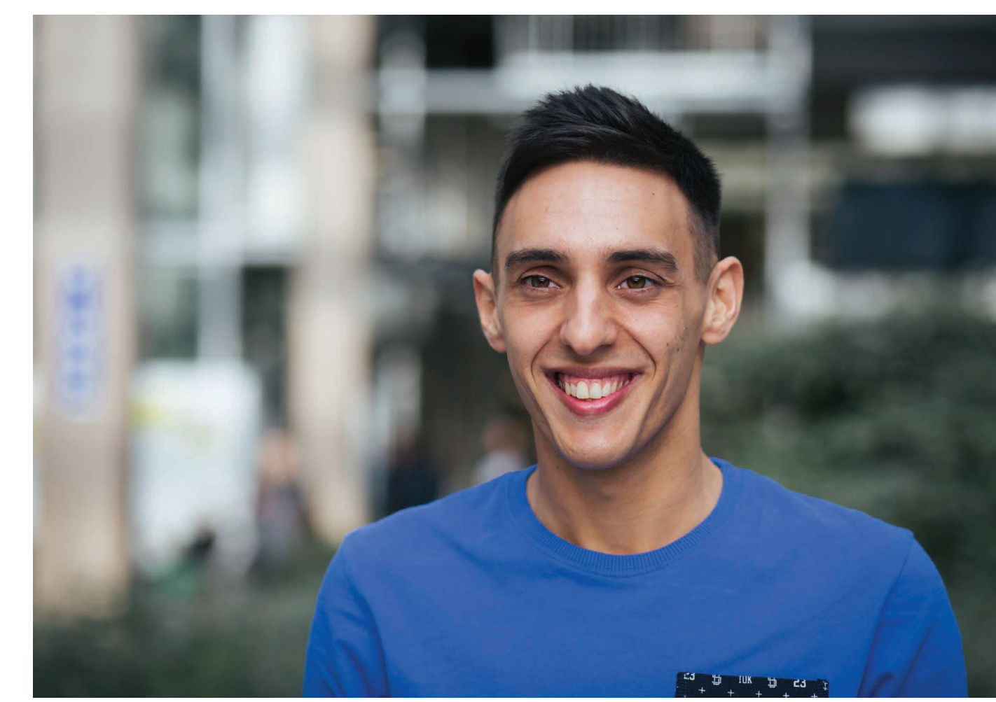
Fotoshooting für Anzeigen