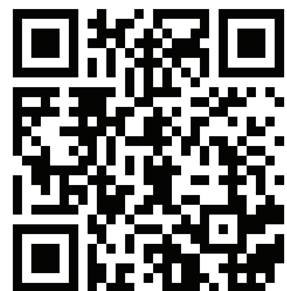
Film über Dzemaal auf YouTube: https://bit.ly/2J16PNA