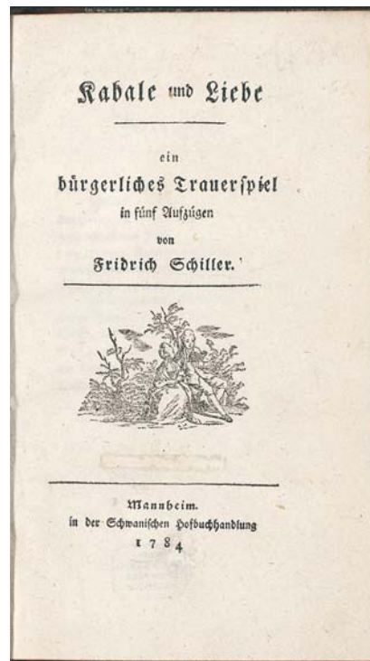
Abbildung 2. Schiller, Kabale und Liebe (1784): Titelblatt des Exemplars der SUB Göttingen, Signatur DD93 A 33272.