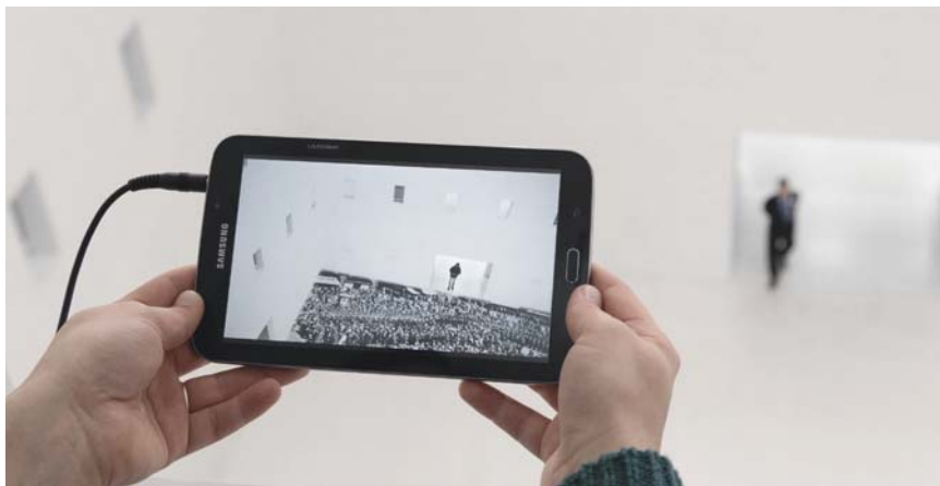
Bewegt sich der Nutzer mit dem Videoguide durch die Bibliothek, hat er auf dem Bildschirm den gleichen Ausschnitt vor Augen wie in der realen Umgebung.

Den Trailer zum Videoguide der Stadtbibliothek Stuttgart gibt es in der BuB-App.