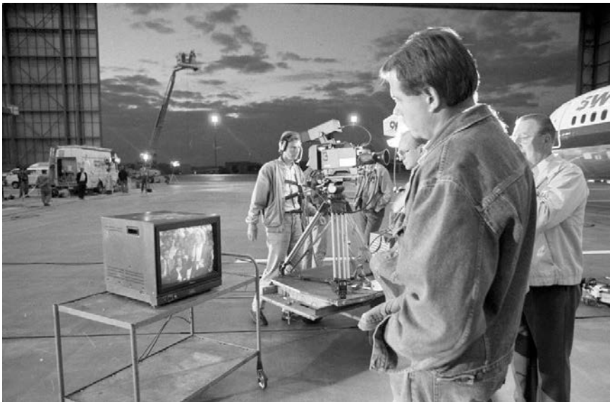
"Wetten, dass ..?" 3. September, Werft Wette Neu: Fernsehshow "Wetten, dass..." in der Werft am Flughafen Zürich-Kloten, 03.9.1988