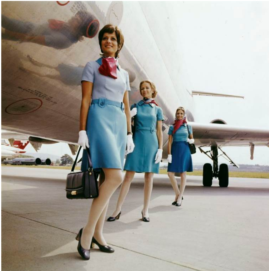
Uniform FA 1960 bis 1970 Neu: Hostessen der Swissair in der von 1970 bis 1977 getragenen Uniform