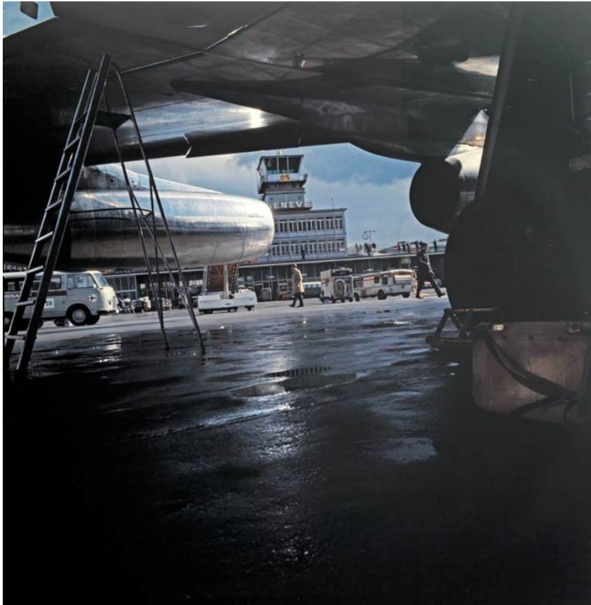
Flughafen Genf : Tarmac Neu: Convair CV-990 Coronado der Swissair auf dem Flughafen Genf-Cointrin, ca. 1953