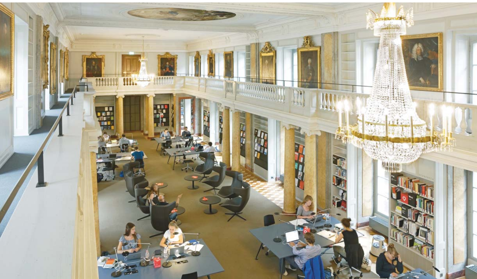
Klassisch: Die Bibliothek Münsterergasse versprüht den Charme vergangener Tage. Hier der barocke Schultheissensaal.