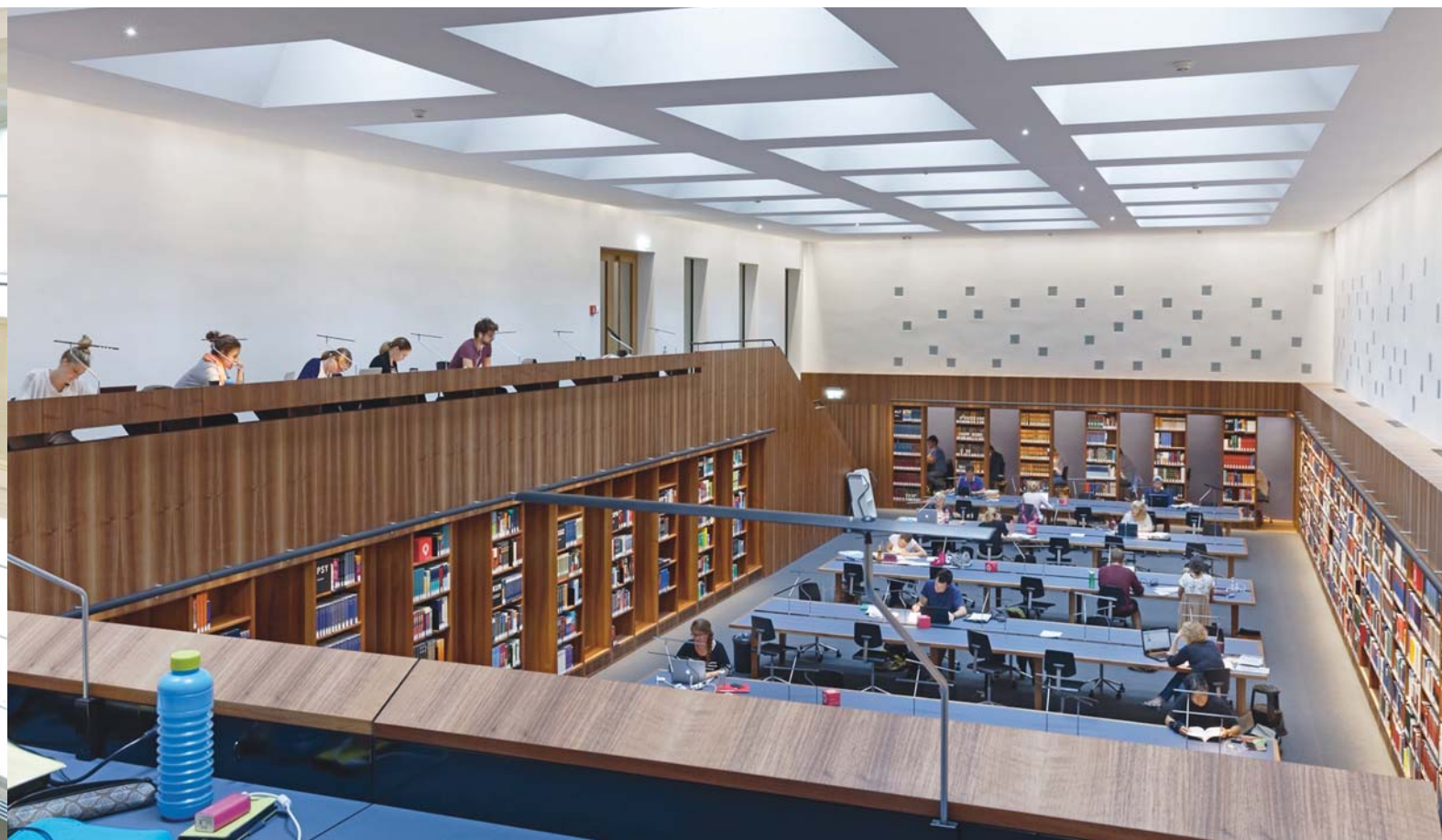
Modern: Im neuen Lesesaal herrschen klare Strukturen. Neben Lesesaalarbeitsplätzen gibt es auch Einzelarbeitsplätze in Nischen (Carrels).

Betriebsanforderungen anzupassen sowie ein Maximum an Helligkeit und Transparenz als dominierenden Raumeindruck zu generieren. Bibliotheksseitig wurde ein neues Profil erarbeitet, das alle Aspekte rund um das »Lernen« im Sinne der Bereitstellung von entsprechender Infrastruktur und begleitenden Dienstleistungen ins Zentrum rückt. In der Summe ergänzen sich die architektonischen Maßnahmen und der lebendige Bibliotheksbetrieb aufs Beste: Es bieten sich der Kundschaft heute freundliche, offene Räume, in denen das Bibliothekspersonal altbewährte und neuartige Services anbieten kann.