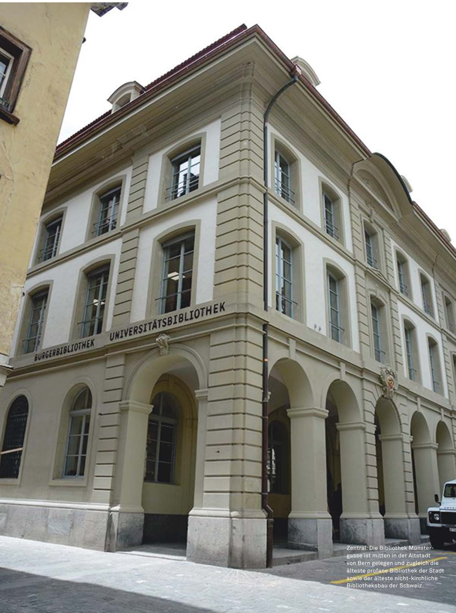
Zentral: Die Bibliothek Münster-gasse ist mitten in der Altstadt von Bern gelegen und zugleich die älteste profane Bibliothek der Stadt sowie der älteste nicht-kirchliche Bibliotheksbau der Schweiz.