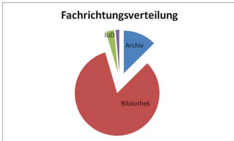
Abbildung 2. Prozentuale Verteilung der 2015 neu geschlossenen Ausbildungsverträge auf die einzelnen Fachrichtungen

fehlen, die Möglichkeiten von Praktika aber aufgrund der auch hier inzwischen geltenden Mindestlohnregelung eingeschränkt sind.