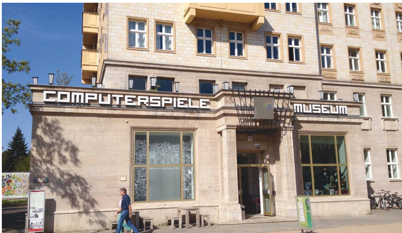
Das Computerspielemuseum in Berlin wurde 2017 mit dem Deutschen Computerspielepreis ausgezeichnet. Im Bestand des Museums befinden sich mehr als 25 000 Datenträger und etwa 120 Konsolen und Computersysteme.