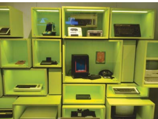
Etwa 120 Spielekonsolen sind im Berliner Computerspielmuseum zu bestaunen.

Da ist mir nichts bekannt. Die virtuelle Spielwelt »Second Life« ist nun bereits 15 Jahre alt. Dort gab es von 2009 bis 2011 eine 3D-Kopie des Dresdner Zwingers. Das war damals ein riesiges