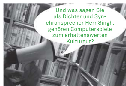
Mehr dazu in der nächsten Folge von »Wissen fragt ...?«.