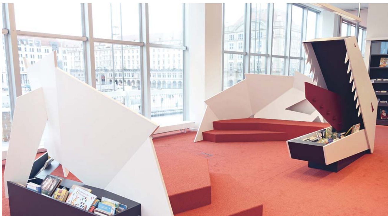
Die Leselandschaft im Kinderbereich der neuen Zentralbibliothek in Dresden ist ansprechend gestaltet.

richtet sich an Schulklassen und Kita-Gruppen und basiert auf einer engen Kooperation mit den Bildungseinrichtungen. Für die meisten von ihnen reicht der asymmetrisch teilbare Veranstaltungsraum aus. Einige Male im Jahr organisiert die Zentralbibliothek Programme, an denen die Nachfrage höher ist. In diesem Fall werden in Kooperation mit der Herkuleskeule und mit der Philharmonie deren Säle genutzt.