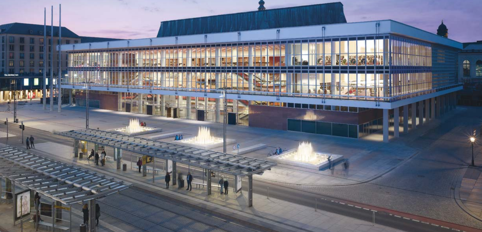
Die Südfassade des renovierten Kulturpalastes, im Herzen der sächsischen Landeshauptstadt Dresden.

Am 29. April 2017 eröffnete nach drei Jahren Planungsvorlauf und vier Jahren Umbau der sanierte Kulturpalast Dresden seine Türen wieder für das Publikum. Größter Mieter sind die Städtischen Bibliotheken Dresden, die hier, in exponierter Lage zwischen Alt- und Neumarkt, für ihre neue Zentralbibliothek (und nicht selbstverständlich auch für ihre Verwaltung) einen perfekten Standort gefunden haben. Das 1969 als Symbol und Verwirklichungsort für eine sozialistische Kultur errichtete Gebäude ist architektonisch ein gelungenes Bauwerk der Nachkriegsmoderne, die zu dieser Zeit über die politischen Systemgrenzen hinweg die Architektur in Europa prägte. Wie in das von Veranstaltungen dominierte Gebäude die Zentralbibliothek mit neuem Konzept eingefügt wurde, zeigt der folgende Beitrag.