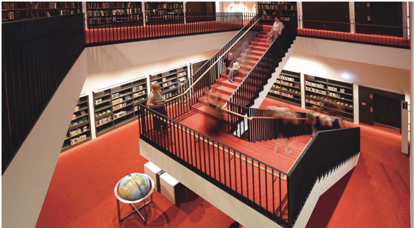
Internes Treppenhaus in der Bibliothek, die mehrere Stockwerke im renovierten Kulturpalast einnimmt.

den Altmarkt. Nach Schließung der Bibliothek verwandelt es sich in ein Konzertfoyer mit mobilen Tresen für Getränke- und Snackverkauf. Wenn die Bibliothek schließt, fahren Rollgitter vor die Vormerkregale und Rollläden werden über die bewegliche Technik auf den Theken gezogen. Gestalterisch bildet das Foyer die sich überlagernden Nutzungen ab. Die Materialien bilden eine Einheit mit den Foyers des Erdgeschosses und des ersten Obergeschosses: Bei den Möbeln dominiert Holzfurnier (Roteiche), die Gestaltung der Decken und einiger Wandverkleidungen folgt denkmalschützerischen Vorgaben. Die Form der Theken und die Art der Integration aller anderen Bibliotheksmöbel in die Raumgestaltung entspricht eher der in den Bibliotheksbereichen.