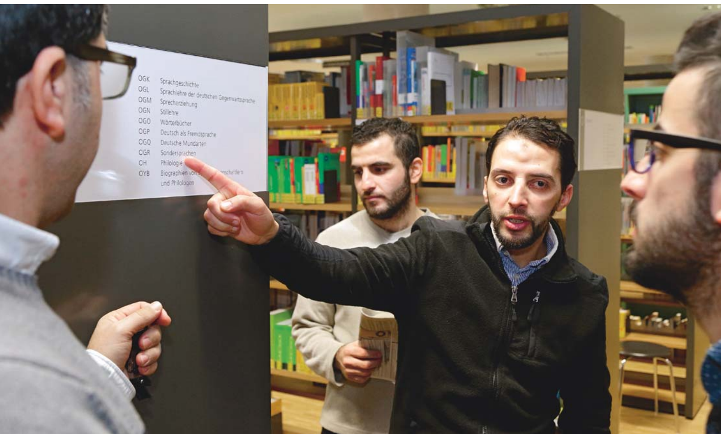
Eine Bibliothek, wie in den folgenden Bildern die Stadtbibliothek Duisburg, muss viele Zielgruppen abdecken: Flüchtlinge ...

Büchern oder anderen Medien zu versorgen. 3 Die »JIM-Studie 2016«, die die Ergebnisse der repräsentativen Befragung von Jugendlichen im Alter von 12 bis 19 Jahren veröffentlicht, kann belegen, dass Bibliotheken nur für 6 Prozent der Mädchen und 3 Prozent der Jungen von Interesse sind. 4 In dieser Altersgruppe zählen nur 38 Prozent und damit nur zwei von fünf Jugendlichen zu den regelmäßigen Lesern. 18 Prozent der befragten Jugendlichen lesen nie. Das sind alarmierende Zahlen für die Bibliotheken. Denn die heutigen Kinder und Jugendlichen sind die Kunden der Zukunft und dieses Potenzial wird von Bibliotheken in Deutschland offenbar nur unzureichend aktiviert. Warum?