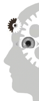
Abb. 1: Der IFLA Trend Report identifiziert fünf Schlüsseltrends, die das Informationsumfeld verändern werden. Grafik: IFLA

Ausführliche Fassung (englisch): trends.ifla.org