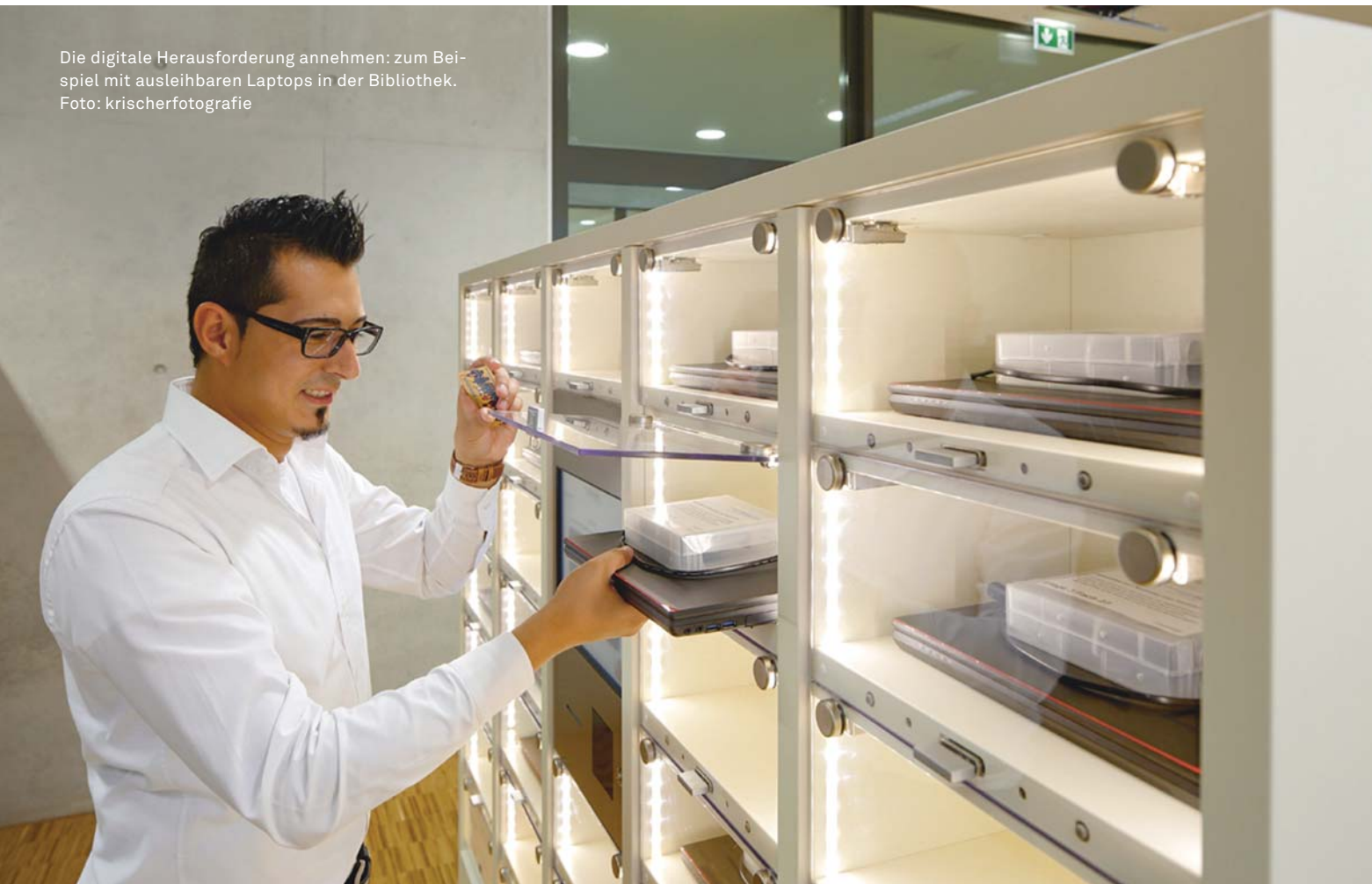
Die digitale Herausforderung annehmen: zum Beispiel mit ausleihbaren Laptops in der Bibliothek.

Am Medienangebot, das von den Menschen dieser Altersgruppen erwartet wird, kann es kaum liegen. In zahlreichen Bibliotheken sind neben einem aktuellen Bestand an Büchern und audiovisuellen Medien die digitalen Medien in Form der Onleihe oder von Overdrive, der PressReader, eine Auswahl von Datenbanken, Angebote zum E-Learning und natürlich das Internet zu finden. Auch das Angebot an Veranstaltungen – von