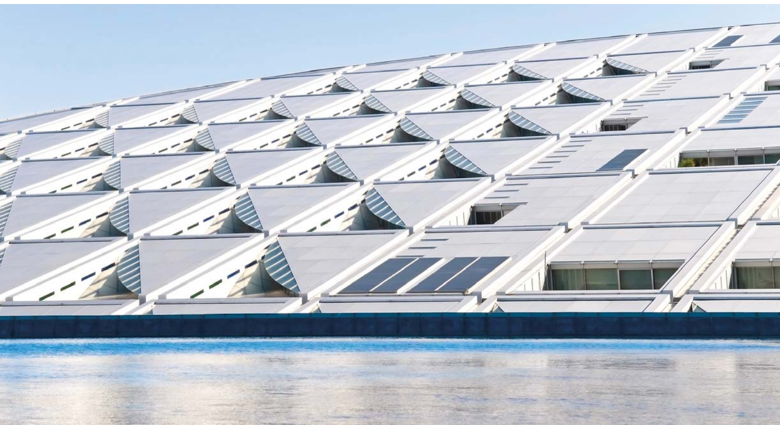
Spektakuläre Architektur: Die Bibliotheca Alexandrina in der ägyptischen Hafenstadt Alexandria.

Der Kampf gegen Terror und Extremismus als gesellschaftlicher Auftrag führt nun dazu, dass diese drei Partner zusammen in die Pflicht genommen werden: die Bibalex, die Al Azhar Universität und die oberste Geistlichkeit – eine Allianz ganz neuer Art. Doch wie arbeiten nun diese höchst ungleichen Partner zusammen? 11