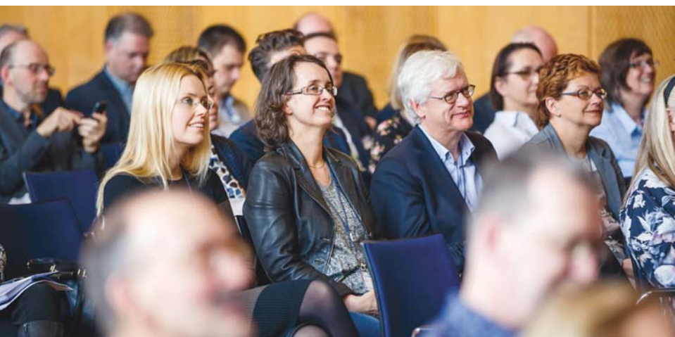
Spannende Referate – aufmerksame Zuhörer: Zum diesjährigen EMEA Regional Council Meeting in Berlin kamen 270 TeilnehmerInnen aus 28 Nationen.

Der »Future Work Skills 2020« kennt darüber hinaus noch einen sechsten Trend. Die Soft Skills werden wichtiger; zum Beispiel Novel and adaptive Thinking, Transdisciplinary und Social