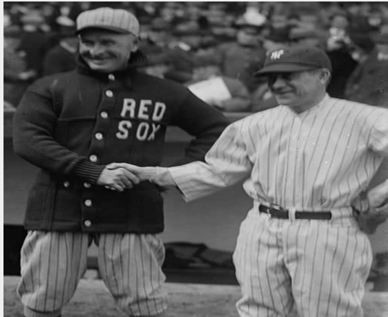
Bain News Service, publisher

http://commons.wikimedia.org/wiki/File:Frank_Chance_and_Miller_Huggins_shake_hands_CROP.jpg