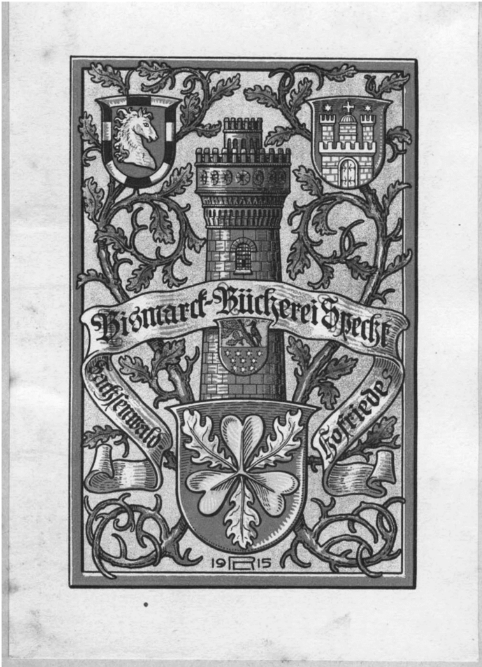
Abb. 1: Exlibris Specht