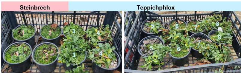
Abb. 3: Versuchspflanzen nach Ende des Monitorings: Steinbrech mit 1) HTG (grob) mit Erde; 50:50 und 2) Pflanzerde; Teppichphlox mit 3) HTG (fein), 4) HTG (grob), 5) Lavadrän 8/16, 6) HTG (fein) mit Erde; 50:50, 7) HTG (grob) mit Erde; 50:50 und 8) Pflanzerde (von links nach rechts).