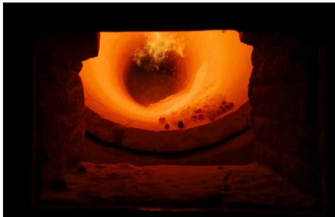
Abbildung 5 Brennen von Leichtgranulaten im direkt beheizten Drehrohrofen der IAB Weimar gGmbH

Brennvorgang im direkt beheizten Drehrohrofen, der in Abbildung 6 dargestellt. Die Sulfatabtrennung durch eine thermische Zersetzung bildet die Grundlage für die Gewinnung von REA-Gips. Die grundsätzliche Machbarkeit der Sulfatabtrennung im Brennprozess wurde bestätigt. Durch die erfolgte Installation eines Nasswäschers und einer stationären Gasanalyse soll die Gewinnung von REA-Gips aus dem Rauchgas ermöglicht werden. Weiterführende Untersuchungen sind derzeit noch nicht abgeschlossen.