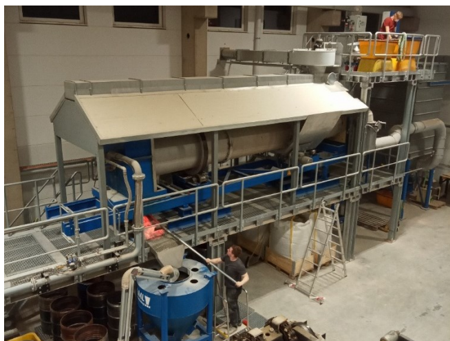
Abbildung 6 Drehrohrofen mit 6 Metern Länge und 0,6 Meter Durchmesser am IAB – Institut für Angewandte Bauforschung Weimar gGmbH

Für die Anwendungstests der leichten Gesteinskörnungen bei den Projektpartnern wurden bisher 2,4 Tonnen Leichtgranulate unterschiedlicher Körnung in der Pilotanlage hergestellt. Einen detaillierten Überblick zu den technischen Parametern der Pilotanlage und den aktuellen Ergebnissen der Herstellung der Leichtgranulate gibt der Beitrag „Leichte Gesteinskörnungen aus Mauerwerkbruch“ der IAB Weimar gGmbH auf der ibausil 2023. [28]