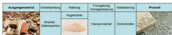
Abbildung 1 Prozessschema zur Herstellung von leichten Gesteinskörnungen aus Mauerwerkbruch

Die Projektidee, leichte Gesteinskörnungen aus Bauschutt herzustellen, hat ihren Ursprung bereits Anfang der 2000er Jahre. An der Bauhaus-Universität Weimar wurden im Labor an einem Gemisch aus Mauerwerkbruch und Porenbeton erste Vorversuche durchgeführt [7]. Auf der Basis dieser erfolgreichen Tests wurde eine Technologie zur Herstellung von Leichtgranulaten aus ziegelhaltigen Bau- und Abbruchabfällen durch thermische Porosierung entwickelt, die in Abbildung 1 dargestellt ist. In einem mehrstufigen mechanischen Prozess mit Brechen, Sieben, Mahlen, Blähmittelzugabe, Homogenisieren und finalem Granulieren werden die Grüngranulate hergestellt. Im Anschluss erfolgt im Drehrohrföfen eine thermische Behandlung der Granulate, die zu ihrer Volumenzunahme bei gleichzeitiger Verfestigung führt.