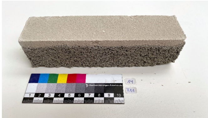
Abbildung 8 Prisma aus Deck- und Füllmörtel mit Leichtgranulaten, Mörtel auf Kalkbasis (Opus Denkmalpflege GmbH)

auch die Zugabe hydraulischer Bindemittelkomponenten wird getestet. Verschiedene Deck- und Füllmörtelrezepturen werden gegenwärtig erprobt. Abbildung 8 zeigt beispielhaft ein Prisma aus Deck- und Füllmörtel auf Kalkbasis. Der Füllmörtel enthält gebrochene Leichtgranulate. Von den am besten geeigneten Mörtelrezepturen werden dann an der BAM die Materialkennwerte, wie z. B. die Festigkeit und das Schwindverhalten, ermittelt. Detaillierte Ergebnisse zur Anwendung der Leichtgranulate in Steinerfüllmassen der Denkmalpflege sind im Beitrag „Leichte Gesteinskörnungen hergestellt aus Bau- und Abbruchabfällen – Applikation in der Denkmalpflege“ der BAM in Zusammenarbeit mit der Opus Denkmalpflege GmbH zur ibausil 2023 zu finden. [29]