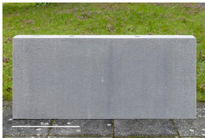
Abbildung 7 Wandelement aus Infraleichtbeton als Demonstrator (Hersteller: Beton und Naturstein Babelsberg GmbH)

Der Projektpartner Beton und Naturstein Babelsberg GmbH hat für die Applikationsversuche im Beton Rezepturen für einen Infraleichtbeton unter Verwendung von Blähglas Liaver und des CO 2 -armen Bindemittels Celitement entwickelt. An der Bundesanstalt für Materialforschung und -prüfung (BAM) erfolgte eine Anpassung der Betonrezeptur für den Einsatz der Leichtgranulate der Körnungen 2-4 mm und 4-8 mm. Die Gesteinskörnungen der Betonmischung bestanden damit zu etwa 65 Volumen-% aus Leichtgranulaten. Der angestrebte Infraleichtbeton konnte tatsächlich auch mit den Leichtgranulaten hergestellt werden. Er weist folgende Eigenschaften bei Prüfung von Betonwürfeln mit 150 mm Kantenlänge auf: Trockenrohddichte 800 kg/m 3 , Druckfestigkeit 10,8 MPa, Gesamtporosität 63,5 %. Das angestrebte Ziel der Herstellung eines Infraleichtbetons wurden erreicht. Erste Wandelemente für einen Pavillon wurden damit bereits hergestellt (Abbildung 7).