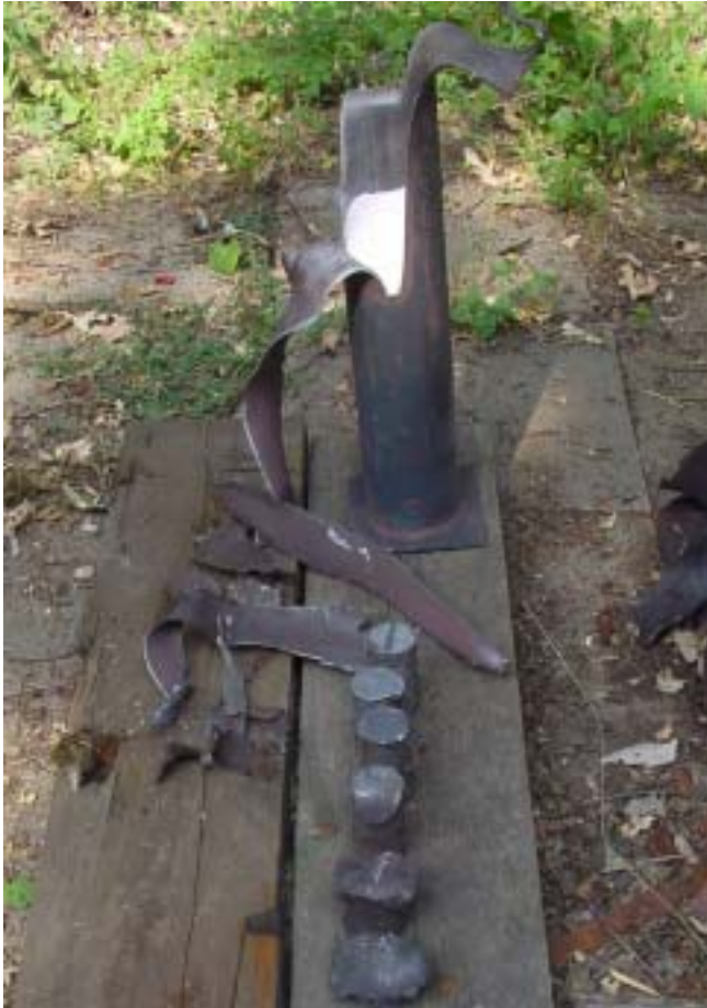
Detonation wurde nicht vollständig weitergeleitet. Drei der sechs Bleizylinder (Originalhöhe = 10 cm) bleiben ungestaucht. Der Detonationstest wurde bestanden.