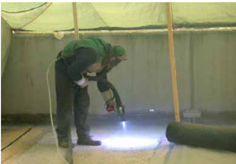
Abb.2: Auftrag der Spritzzinkschicht an einem Parkhaus