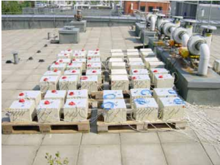
Abb. 4: Auslagerung der Probekörper auf einer Dachfläche, BAM

Bei geringeren untersuchten Chloridgehalten kam es vermutlich infolge der Austrocknung der Zink/Beton-Kontaktzone nach relativ kurzer Zeit zu einer Inaktivierung des Zinks. Bei Chloridgehalten von 4 M.-% bildeten sich zwischen der Zinkschicht und dem ausgewählten OS-System gasgefüllte Blasen. Diese Problematik, sowie die Tatsache dass die Wirksamkeit des Prinzips W (Austrocknung des Betons) bei derart hohen Chloridgehalten bezweifelt werden muss, grenzt die Anwendbarkeit des Kombinationssystems mit der Zinkschicht als Opferanode deutlich ein ( Tab. 1 ).