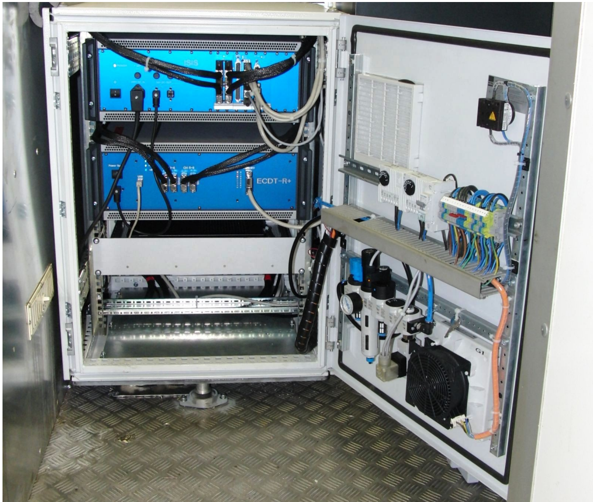
Abbildung 1: 19"-Schrank mit ISIS-Gerät (oben), Wirbelstromprüfgerät (Mitte) und Druckluftaufbereitung für den Sondenträger (Tür)

Die neuentwickelte Wirbelstromprüfmechanik gleicht Kurvenfahrten (bis zu einem Bogenradius \geq 150 m) und Sinuslauf selbstständig aus. Ein spezielles Messdrehgestell ist nicht erforderlich. Die maximale Prüfgeschwindigkeit beträgt 20 km/h. Der Arbeitstemperaturbereich wird durch die Pneumatik bestimmt und beträgt -5^{\circ}\text{C} - 55^{\circ}\text{C} . Im Falle von Strom- oder Druckluftausfall fährt die Mechanik automatisch in die Ruheposition ein. Die Wirbelstromsonden werden innerhalb des Sondenträgers einzeln geführt, so dass ein konstanter Abstand der Sonden zur Schienenoberfläche gewährleistet ist. Die Sonden werden auf Anschlag im Sondenzug montiert. Hierdurch entfällt eine mechanische Justierung der Sondenabstände. Durch die Laufrollen der Sondenzüge (Abbildung 2) sind die Sonden sehr gut vor mechanischen Beschädigungen geschützt.