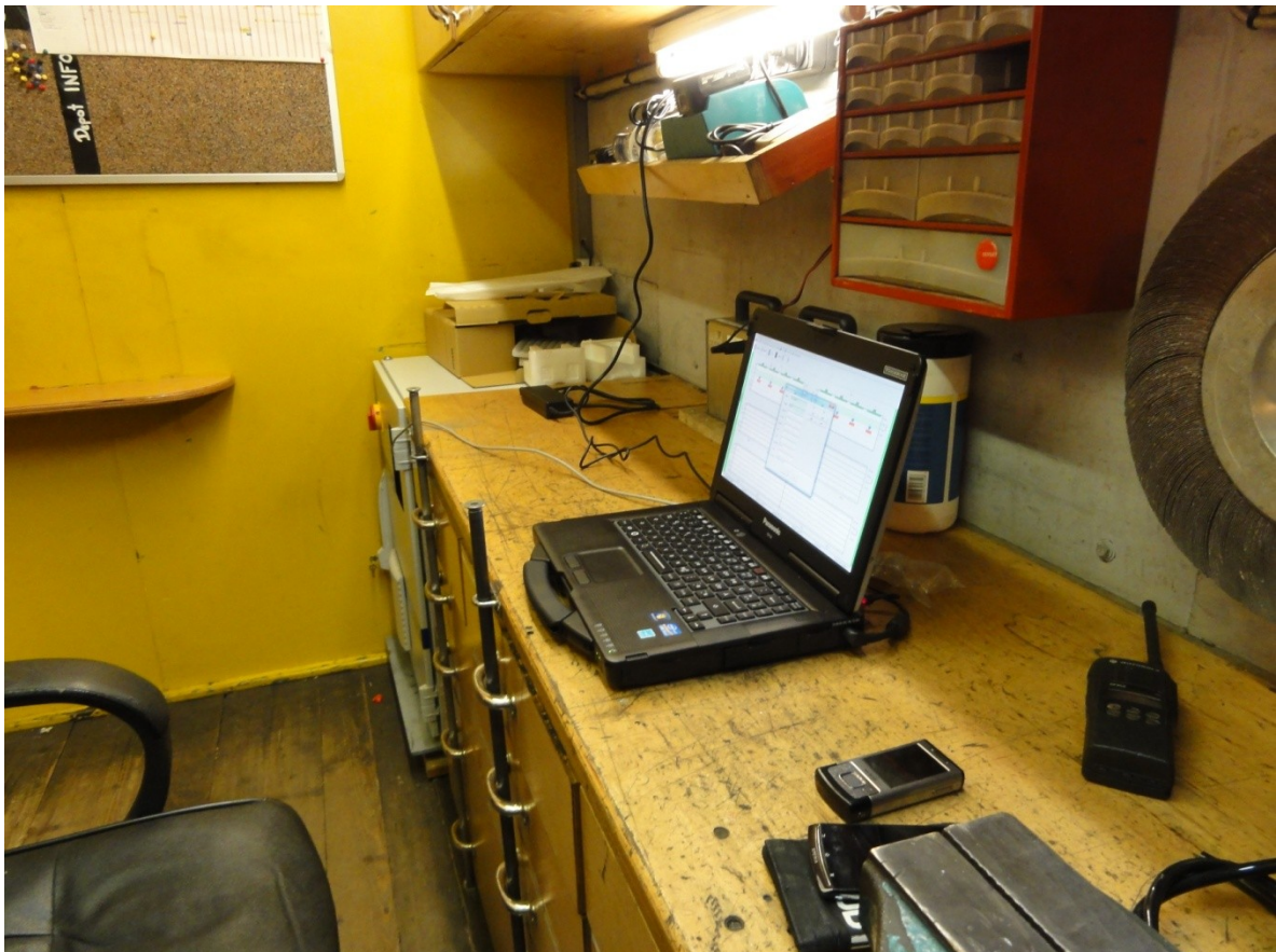
Abbildung 3: Laptop zur Bedienung des Prüfsystems (im Werkstattwagen einer Schienenbearbeitungsmaschine)

Zur Bedienung des Prüfsystems wird ein PC mit Windows™ als Betriebssystem benötigt. Bei den beengten Platzverhältnissen auf den Schienenbearbeitungsmaschinen bietet sich die Verwendung eines industrietauglichen Laptops an. Die Verbindung zum Rest des Prüfsystems erfolgt über USB. Durch Einsatz von USB-Extendern ist ein großer Spielraum für die Positionierung dieses PC gegeben. Er kann wahlweise in einer der Fahrerkabinen oder einem beliebigen Ort auf der Maschine positioniert werden kann (Abbildung 3). Durch Einsatz eines Touchscreen wird die Bedienung erleichtert.