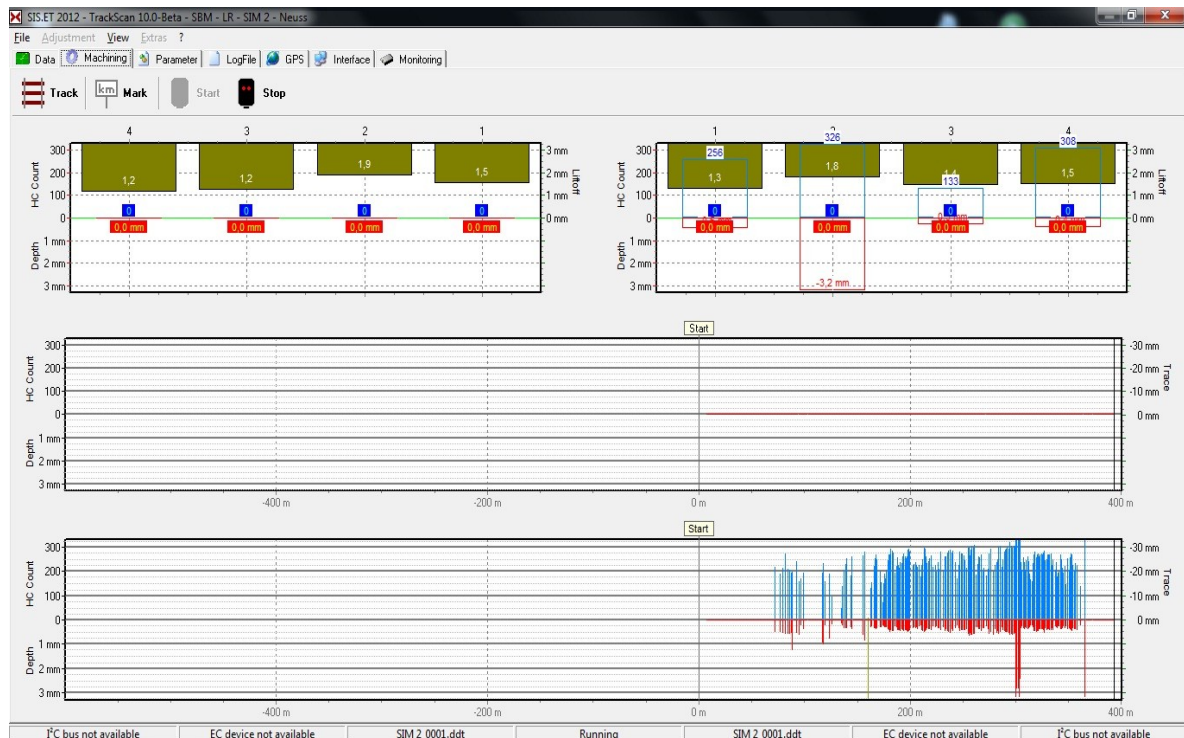
Abbildung 4: Beispiel Arbeitsbildschirm im Schienenbearbeitungsmodus

Auch Softwareseitig hat sich einiges getan. Die Funktionalität der Schleifzugsoftware „GrindScan“ wurde in die Prüfzugsoftware „TrackScan“ integriert. Die Funktionen zur Anpassung der Geräteparameter an die Sondeneigenschaften (Justierung) sind ebenfalls Teil von „TrackScan“. Bei einigen früheren Systemen wurde hierzu noch ein Zusatzprogramm (SIS.DT.Calibration) benötigt. Es existiert also nur noch eine einheitliche Software für Prüfzüge und Schienenbearbeitungsmaschinen, die die Konfigurierbarkeit der Schnittstelle zum Zugsystem und die besonderen Anforderungen der Prozesskontrolle bei der Schienenbearbeitung miteinander vereint. Abbildung 4 zeigt den Arbeitsbildschirm im Schienenbearbeitungsmodus.