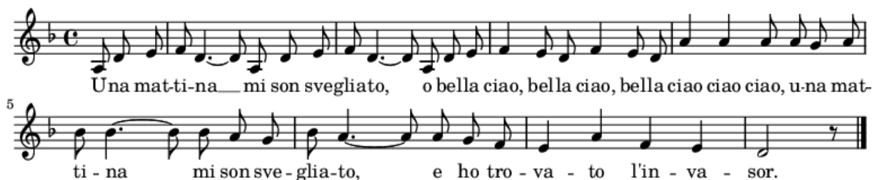
Abbildung 1: Bella ciao

Bella ciao ist ein Lied im 4/4-Takt, dessen Strophen jeweils acht Takte umfassen. Die kurzen melodischen Motive werden stets auftaktig mit drei Achteln eingeleitet. Dies prägt den rhythmisch schwungvollen Charakter des Liedes. Das Lied hat eine eingängige Melodie in Moll, basierend auf drei Harmonien (hier: D-Moll, G-Moll und A7) und eine sich steigernde Dynamik der bis zum sechsten Takt vertikal aufwärtsstrebenden Melodie.