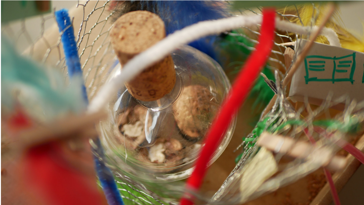
Berlin 2020