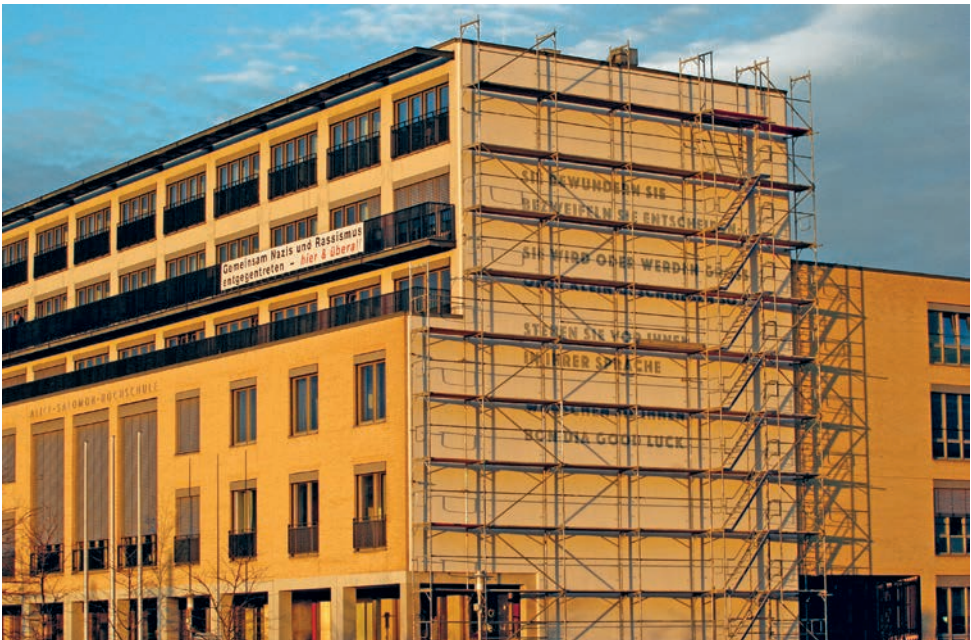
Eingerüstete Südfassade, auf der im Dezember 2018 das Gedicht von Barbara Köhler angebracht wird