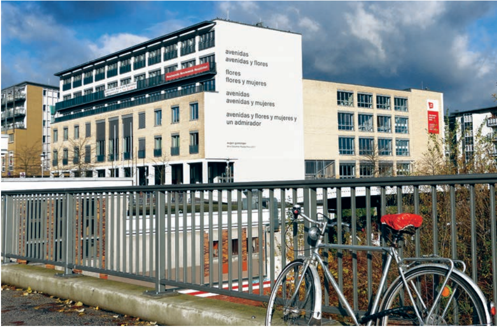
Haupt- und Südfassade mit Gedicht avenidas von Eugen Gomringer im November 2017