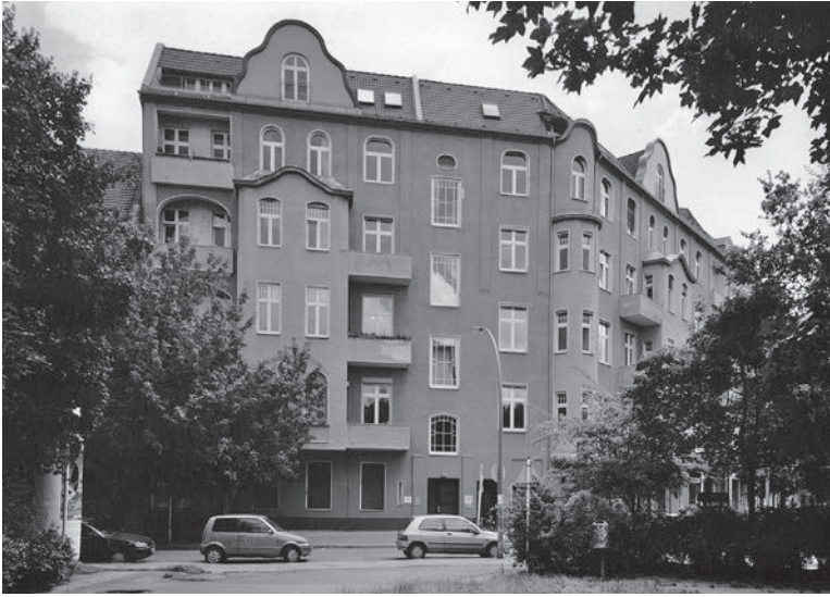
Verwaltungsgebäude der FHSS in der Karl-Schrader-Straße 6 in Schöneberg