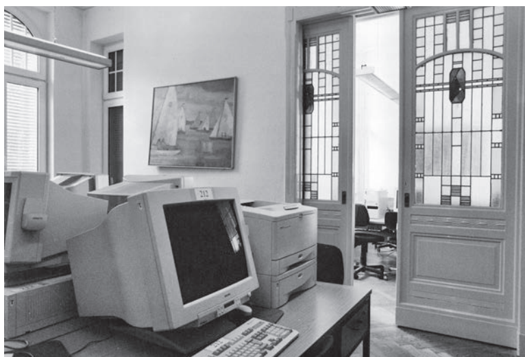
Computerraum der FHSS in Schöneberg

Nach fast 25 Jahren in Hellersdorf reden wir inzwischen von Informations- und Kommunikationstechnik (ITK), und neue spannende Herausforderungen liegen vor dem mittlerweile auf 14,5 Vollzeitstellen angewachsenen ComZ-Team: Die Infrastruktur (Verkabelung und Netzwerktechnik) entspricht nicht mehr dem aktuellen Stand der Technik und muss aufwändig erneuert werden, Daten- und Sprachkommunikation wachsen zusammen, die Hochschule wächst und entwickelt sich zu einer Campushochschule mit mehreren Standorten, das etablierte Campus-Management-System soll durch eine neue Lösung ersetzt werden, ITK muss sich von einem unterstützenden Werkzeug zum medienbruchfreien Arbeitsmittel entwickeln, neue Lehr-, Lern- und Arbeitsformen (Online-Unterricht, Home Office) müssen unterstützt werden.