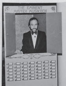
Kopiervorlage der FHSS-Sonderinfo zur Technologietagung der FHSS 1983 vom Februar 1984, S. 13