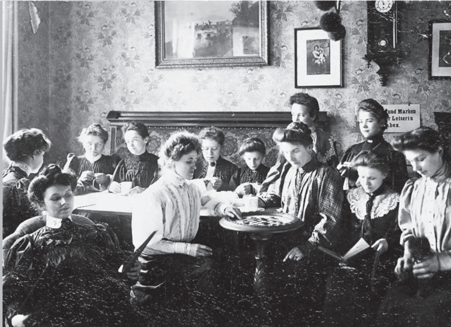
Arbeiterinnen-Heim (vor 1929)