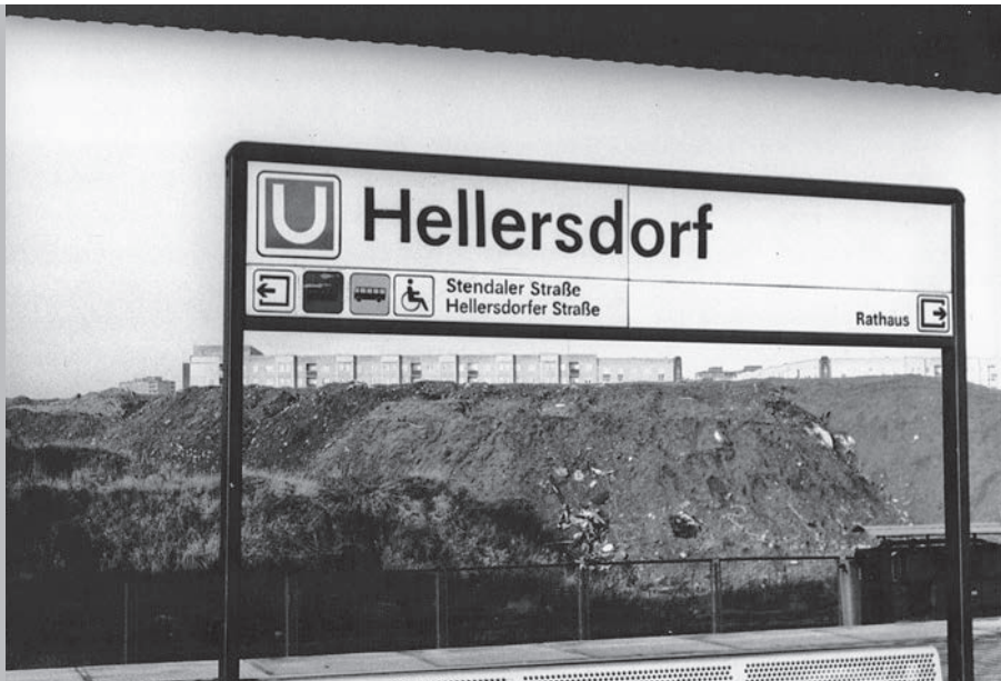
U-Bahnhof Hellersdorf in den 1990er Jahren. Im Hintergrund die Baustelle des Hauptgebäudes der ASH Berlin

International – von Anfang an! | Schon Alice Salomon hat Soziale Arbeit stets international gedacht. 1929 gründete sie mit Kolleg_innen aus Frankreich, Belgien, Polen, Großbritannien, Österreich und der Schweiz in Berlin die heutige International Association of Schools of Social Work (IASSW), deren Mitglied die ASH Berlin bis dato ist. In der Gründungsresolution wurden Leitlinien für internationale Zusammenarbeit benannt, die auch aktuell Gültigkeit für die Hochschule und für die Arbeit des International Office besitzen: Der Austausch von Meinungen und Erfahrungen zwischen den Schulen (heute: Hochschulen) sollte ermöglicht und Probleme des internationalen Austausches der (Hoch)Schulen sowie der Austausch von Lehrenden und Studierenden sollten behandelt werden, aber auch internatio-