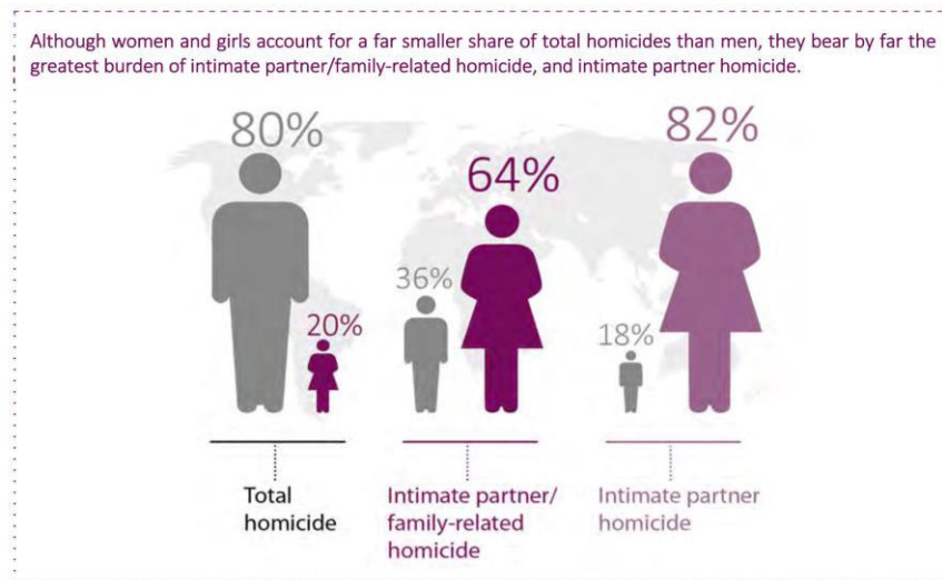
Abbildung 1: Prozentsatz der Tötungsdelikte weltweit im Jahr 2017, unterteilt nach Geschlecht (United Nations Office on Drugs and Crime, 2018, S. 13)

Prozent dieser Frauen durch den eigenen Partner oder einem anderen Familienangehörigen getötet wurden. Daraus ergibt sich eine große Diskrepanz zwischen den Geschlechtern, wie die folgende Abbildung darstellt: