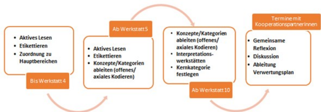
Abb. 1: EIfE-Auswertungsprozess [50]

Im Anschluss organisierten wir einen Workshop aller drei Forschungsteams, für den wir in Anlehnung an M'BAYO und NARIMANI (2015) den Begriff big discussion day wählten, auch wenn es sich hier nicht um einen Fachtag handelte. Vielmehr nutzten die Forschungsteams diesen Tag, sich die bis dahin