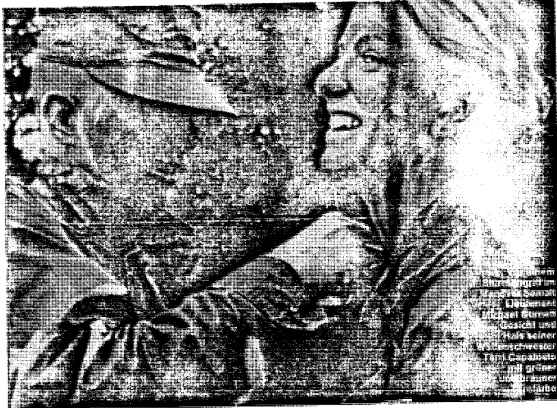
Krieg zwingt Haben raus und Sein rein: Für die Frau ist dieser Vorgang keineswegs anders; sondern nur etwas verwickelter.

„Die neue Gesellschaft bedroht niemandes Eigen- tum... Die hohen Gehälter der Führungskräfte