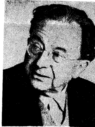
Erich FROMM, né à Francfort en 1900, études à Heidelberg, installé aux Etats-Unis en 1934, vivant actuellement en Italie, auteur d'une vingtaine d'ouvrages parmi lesquels « La peur de la liberté », « L'art d'aimer », « Société aliénée, société saine », etc...

Psychanalyste allemand installé depuis 1934 aux Etats-Unis, Erich Fromm a joué un rôle de premier plan dans le domaine de la sociologie psychologique. Par son livre « Autorität und Familie » (1936), notamment, il a introduit dans la psychanalyse deux notions négligées jusque-là par Freud et par Jung : celle de l'histoire et celle de l'environnement social. Critiquant la théorie des instincts de Freud qui lui paraît figer l'homme dans une nature biologique, il professe que « la nature de l'homme, ses passions et son angoisse sont un produit de la culture : en fait, l'homme est lui-même la création et l'œuvre la plus importante de la continuité de l'effort humain que nous appelons l'histoire ».