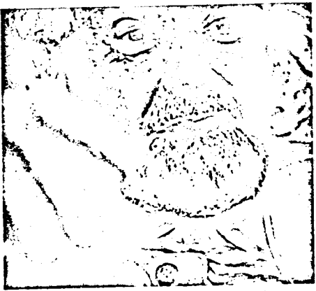
Lorenz: a agressão é um impulso...

5000 K O L N 1 LOTHRINGER STR. 81 TELEFON (0221) 31 47 61 TELEX B 881 650 abrg d