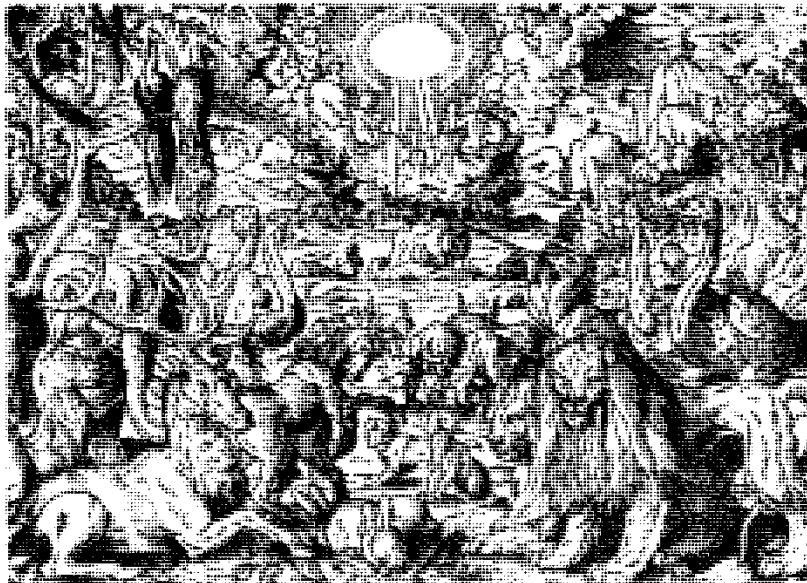
Marcuse-Ideal Garten Eden: Weltfremde Illusion?

Grundsätzlich wirft Fromm dem Philosophen — und einstigen Heidegger-Schüler — Marcuse vor, die empirische Forschung Freuds, die „klinische Grundlage“ seiner Theorie, vernach-