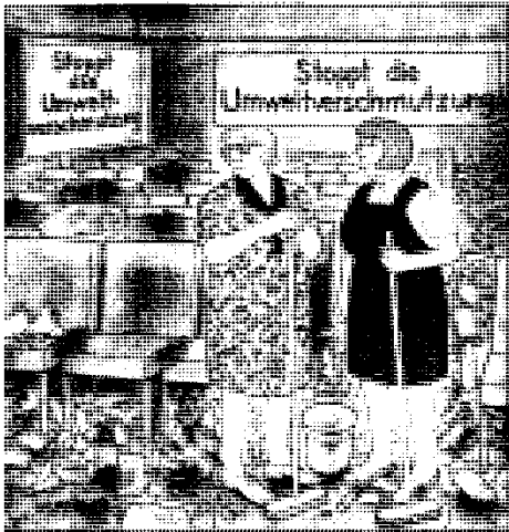
Aus dem STERN

Heimlich, in aller Stille, wollten zwei Chemie-Giganten ein Ungeheuer zu Grabe tragen, das vor vier Jahrzehnten aus ihren Retorten schlüpfte — und als einer der bedrohlichsten und weitestverbreiteten Giftstoffe in der Umwelt des Menschen entlarvt wurde.