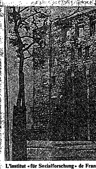
L'Institut « für Sozialforschung » de Francfort, en 1924.

L'analyse qu'elle fait de la rationalité diverse tant de la solution positiviste, à laquelle elle reproche la déshumanisation, que de l'approche centrée sur le sujet considéré hors de son existence sociale.