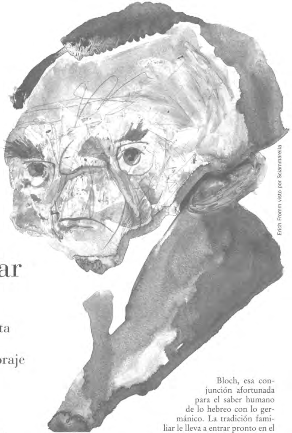
Erich Fromm visto por Sciammarella

Bloch, esa conjunción afortunada para el saber humano de lo hebreo con lo germánico. La tradición familiar le lleva a entrar pronto en el mundo de la Biblia. Van a ser los profetas de Israel por su clamor a favor de los marginados (Amós, Isaías, Jeremías, etc.) los autores preferidos dentro del libro sagrado. También se acerca a la mística judía. La Primera Guerra Mundial con sus innumerables muertos provoca en el joven Fromm un impacto devastador que ya nada va a ser capaz de borrar. Un impacto reforzado hasta lo ilimitado por la shoan u holocausto. La cuestión de la paz y la guerra estarán siempre presentes en su espíritu. Será uno de los líderes del pacifismo en los Estados Unidos en los días de la Guerra Fría. La filosofía, la psicología y la sociología son las ciencias con que se familiariza en las universidades de Frankfurt, Heidelberg y Munich. Sus maestros principales son Drisch, Jaspers, Rickert y Weber. Trascendental en su vida, el encuentro con la obra de Karl Marx y Sigmund Freud. Sintoniza con el primero,